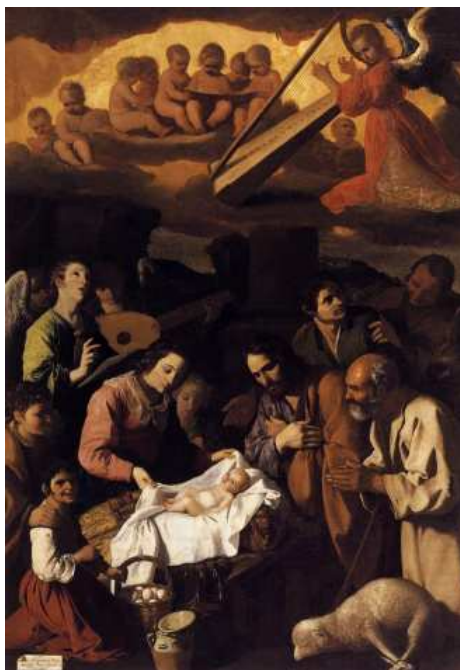
1. ábra Francisco de Zurbarán: A pásztorok imádása (1598-1664)