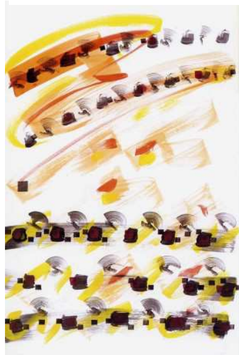
7. ábra Nádler István: Hommage á Ligeti György