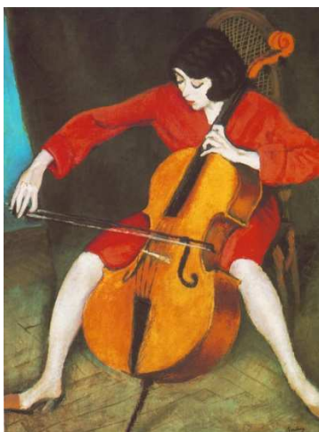
4. ábra Berény Róbert: Csellózó nő (1887-1953)