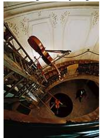
8. ábra Rebecca Horn: Tower of the Nameless