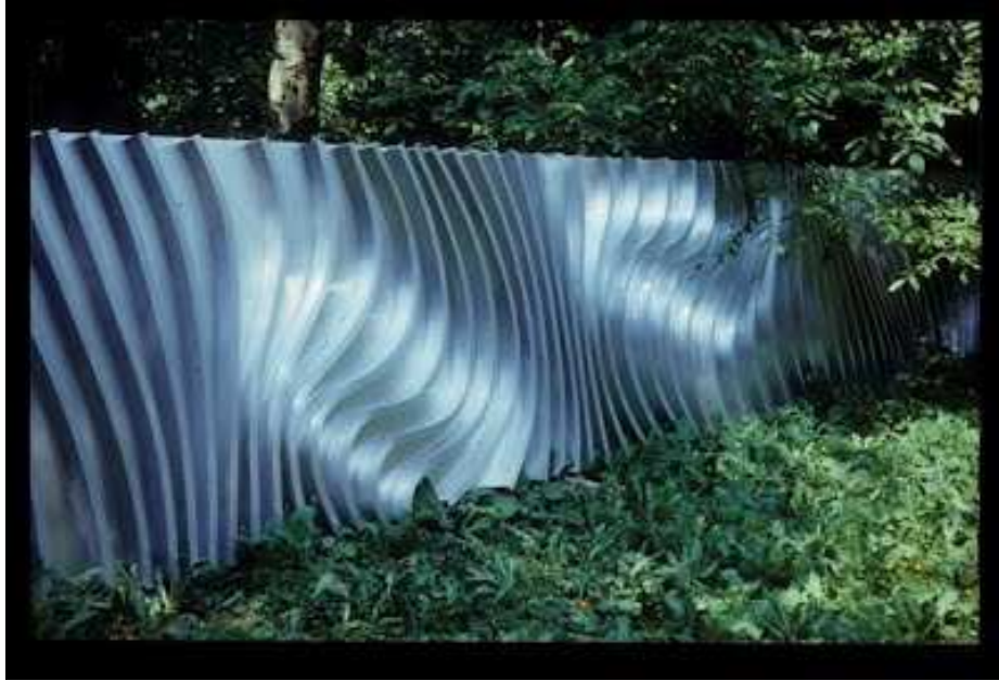
9. ábra Farkas Ádám