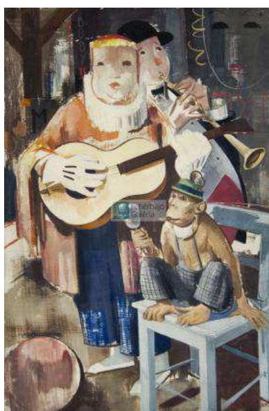
5. ábra Aba Novák Vilmos: Cirkusz