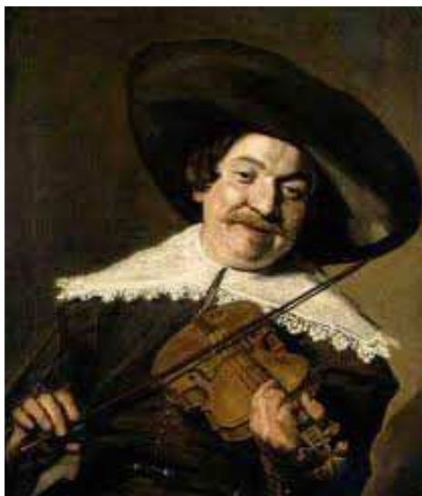
3. ábra Frans Hals: Daniel van Aken Playing the Violin(1580 körül- 1666)