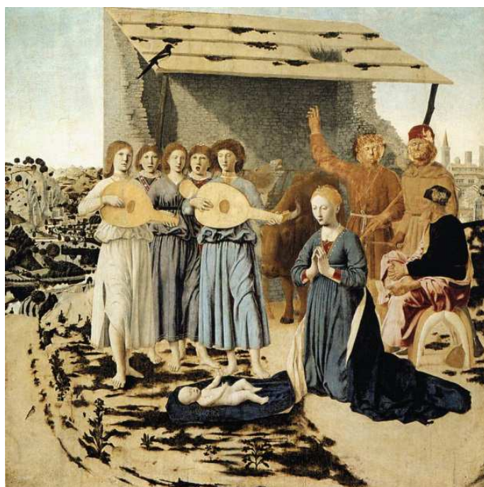
2. ábra Piero della Francesca festménye (kb. 1420-1492)

A téma népszerűsége nem csökkent a reneszánsz óta. Másik megjelenési közegében, a világi témák között is bőven találkozunk zenészeket ábrázoló képekkel. Gondolhatunk Frans Hals kocsmaképeire (XVI.-XVII. sz.), Picasso (XX.sz.) vagy Aba Novák Vilmos festményeire.