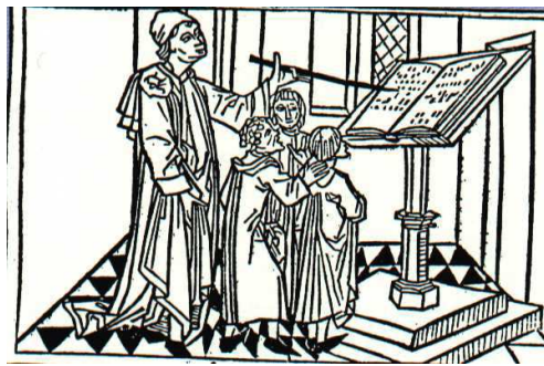
2. ábra: Szerzetes oktatja a kóristákat 6

Érdekesség, hogy már az első századok forrásai említést tesznek a lektorokról és a pszalmistákról (gyakran gyermekek!), akik e feladatra kiképzést kaptak. A római egyházi élet szokásrendje szerint a gyermekkortól együttnevelt énekesfiúk és felnőtt társaik a későbbi századok folyamán egységes testületté, „ scolá ”-vá alakultak, élükön az énekmester állt. Ennek intézményesülése, a római Scola Cantorum megalapításának ideje vitatott, de valószínűleg a 7. századra tehető, de ez nem zárja ki a képzett énekesek tevékenységét már a megelőző századokban. (Dobszay, 1993. 51.)