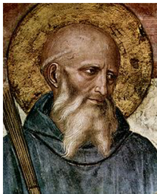
1. ábra: Nursiai Benedek; Fra Angelico freskója (San Marco, Firenze, kb. 1400 -1455.) 3

A legtöbb információt erre az időszakra vonatkozóan Nursiai Benedek (480 körül – 547) Regulájából meríthetjük. A bencés rend alapítója szabályzatában részletesen bemutatja a szerzetesi élet és a zsoltosma állandó rendjét: ez utóbbiban a szertartásokat és a zenei követelményeket is. A Regula nem más, mint egy jellegzetesen humán kulturális és egyben vallásos igény beteljesítése: egységes értékrendet közvetít az akkori jelenben élők és rögzít az utókor számára. Megtölti a hétköznapokat és az ünnepeket tartalommal, a profán valóságot mintegy megszenteli s ezáltal magasabb rendű életérzést biztosít, valamint a közösséghez tartozás élményét nyújtja a résztvevők számára.