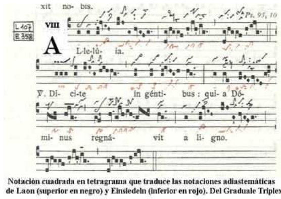
Notación cuadrada en tetragrama que traduce las notaciones adlastemáticas de Laon (superior en negro) y Einsiedeln (inferior en rojo). Del Graduale Triplex

Az európai zene egységes jelrendszerének kialakulása (az egyszólamú dallam – repertoár és a notáció korai időszaka)