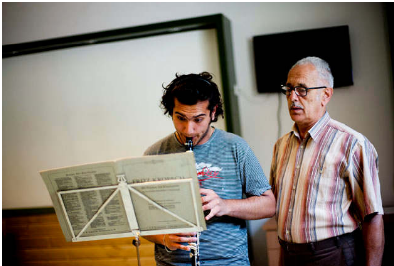
10. ábra Klarinétóra

maguk is példaképek: klasszikus, jazz és pop-zenészek itthonról és a nagyvilágból, akik a kiválasztottakba különleges bizalmat fektettek, és az utóbbiak megéreztek ezt a kötődést. Ez a fajta kapcsolat nem jellemző a „nyitott” és több évszázada véletlenszerű átlagiskolákra. A kiválasztás – döntő mozzanat: elvárásokat és magas igényeket jelent. A diákokkal szembeni, tiszteletből fakadó igényesség („követelek, mert tisztellek”) a nevelői hatás záloga.