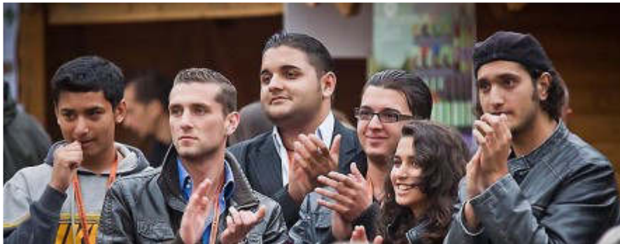
6. ábra Először együtt

tanévre is meghívtak. Általános az a tapasztalat, hogy a zenében magabiztosságot szerző, személyiségükre jobban rátaláló fiatalok iskolai teljesítménye otthoni környezetükben is javult.