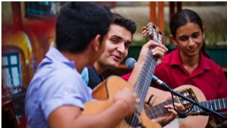
8. ábra Gitárból több kell