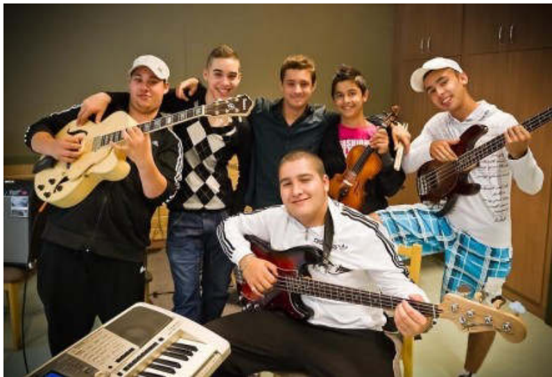
12. ábra We are the champions (mi vagyunk a bajnokok)