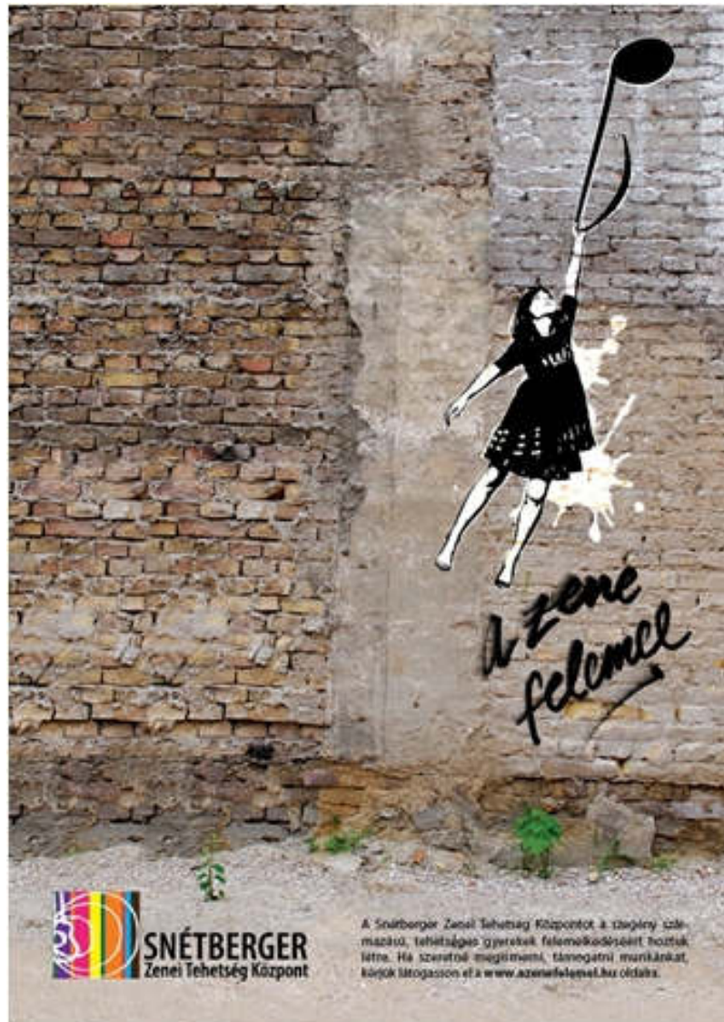
13. ábra A Snétberger Zenei Tehetség Központ logója

zenében elkötelezettek számára. Tevőlegesen várjuk, hogy mikor lesz a kivételtől szabály.