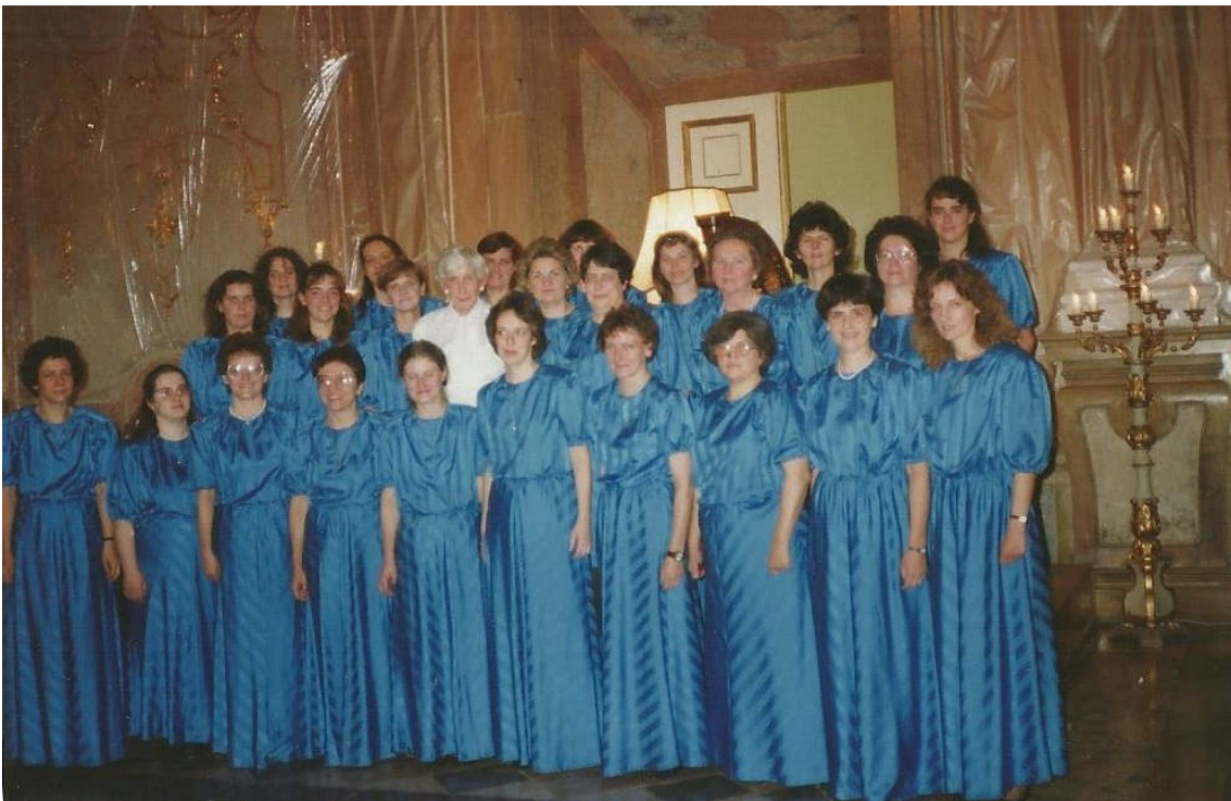
A Szilágyi Erzsébet Női Karral 1990 körül