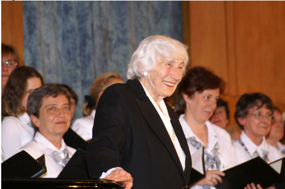
A Szilágyi Női Kar a Parlamentben, 2006 körül

nagy madrigálok, és akkor mentek a nagy Kodályok, amiket mindig úgy irigyeltem, és meg tudtam csinálni. Aztán voltak elképesztő összeesések, hogy az apám még el se volt temetve, és nekem az Öregeket kellett dirigálnom. De szép volt.