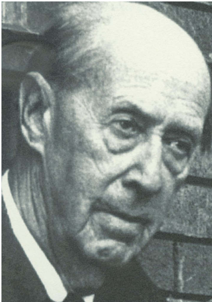
Márai Sándor