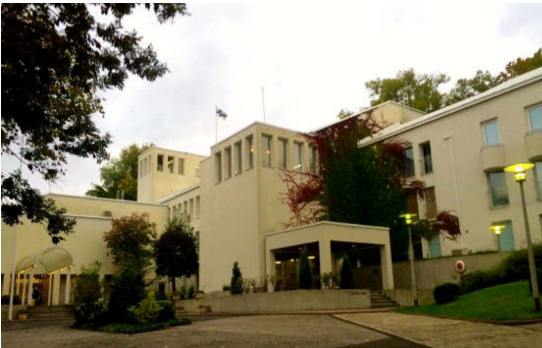
Finnország Nagykövetsége, Budapest