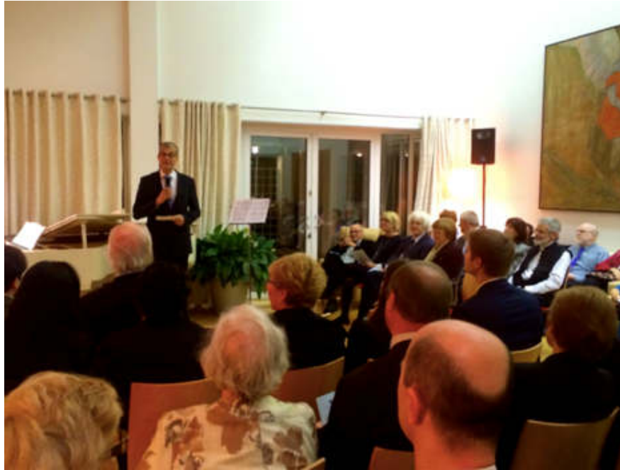
Köszöntőt mondott az ünnepi hangverseny elején Pasi Tuominen Nagykövet Úr