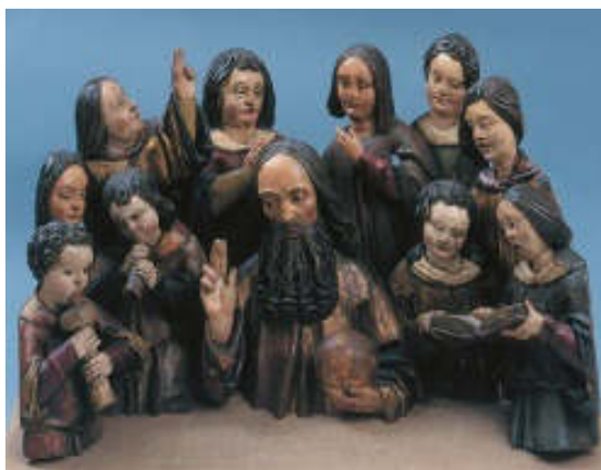
Ismeretlen szobrász: Atyaisten éneklő és zenélő angyalokkal , 1510-20 körül, fa, 34 x 61 cm, Keresztény Múzeum, Esztergom

A szakdolgozatomban leírt zenés múzeumi óra tervemben a Keresztény Múzeumban látható későgótikus Atyaisten éneklő és zenélő angyalokkal szoborcsoporthoz kapcsolódóan először a gyerekekkel közösen összeszedjük a gregorián ének jellemzőit (latin, egyszólamú, hangszerkíséret nélküli...stb.). Ezután kiosztok mindenkinek egy lapot, amelyen az általuk már a tanóráról ismert Mária-himnusz kottáját láthatják, úgy, ahogy a tankönyvben szerepel, ötvonalas rendszerben, illetve igazi gregorián kottaként is. Majd közösen elénekeljük a rövid részletet.