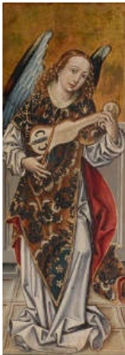
B.E. mester: Angyal hegedűvel , 1494, tempera és arany, fa, 100 x 36,5 cm, Keresztény Múzeum, Esztergom

máshogy fogja megformálni a hangszerét, megmutathatják az egyéniségüket. A megfigyelőképességükre is szükségük lehet.