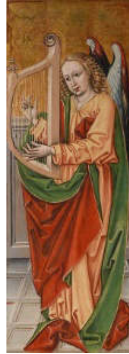
B.E. mester: Angyal orgonával, Angyal lanttal és Angyal hárfával , 1494, tempera és arany, fa, 100 x 36,5 cm, Keresztény Múzeum, Esztergom

További hangok, zörejek is használhatóak az állathangoktól az utca zaján át, de mindenképpen a múzeum tárgyakhoz, a múzeumi foglalkozás kérdésköréhez kapcsolódva. Ezzel a módszerrel tehát elszakadhatunk a zenés témájú alkotásoktól, hiszen szinte bármilyen témakörhöz találunk olyan hanghatást, amivel közelebb kerülhetünk a műben rejlő tartalmakhoz.