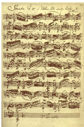
Johann Sebastian Bach: BWV 1001-es számú hegedű-szólószonátájának kézírata, 1720

Hasznos lenne a gyerekeknek a különböző művészeti ágakat összekapcsolni bizonyos esetekben, hiszen a fiatalokban egy komplex tudás úgy integrálódhat könnyebben, ha egymás mellett jelennek meg a különböző művészi alkotások, tevékenységek. A magyar népzene a magyar nyelv és irodalommal, a történeti énekek a történelem órával állnak kapcsolatban. A diákok művészettörténet vagy a rajz és vizuális kultúra órán szerzett ismereteit össze lehetne kapcsolni a zenetörténeti korszakokkal és a hangszertörténettel. Az ún. hangszínérzék fejlesztése már általános iskolás korosztályoknál is fontos, ez az adottság segíti a zenetörténeti korszakok, zeneművek stílusának felismerését. Az órán megfigyelt különböző stílusú festmények a zenei stilisztikai különbségek felismeréséhez nyújthatnak segítséget. Példának említeném a dinamikus, mozgalmas barokk zene és egy díszes barokk festmény összehasonlítását.