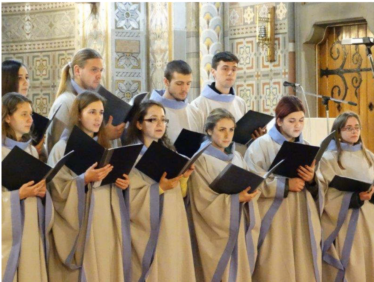
A Kapisztrán Ferences Ifjúsági kórus hangversenye 2015. december 6-án a szabadkai Szent Mihály (ferencesek) templomában ( www.mariaradio.rs )