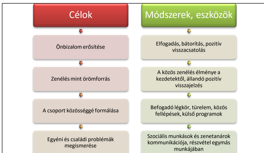
4. ábra: A Szimfónia program célrendszere és a célok elérésére használt eszközök (ábra: Kecskés D.-Vértesy Júlia)

pedagógus részéről a lakókörnyezet megfigyelésére és a szülőkkel való megismerkedésre, beszélgetésre.