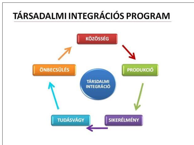
2. ábra: A Szimfónia program motorjának alkotóelemei 21

Ezen távlati célok eléréséhez közelebbi célként tűzik ki, hogy minden egyes tanórán a zenélés örömforrás legyen minden gyerek számára, az önbizalom növelése érdekében szereplési lehetőséghez juttassanak minden gyereket (koncerteken, vagy akár csak az óra keretein belül), a csoportot közösséggé formálják, az egyéni és családi problémákat megismerjék.