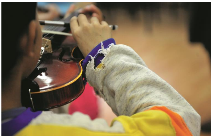
1. kép: A Szimfónia program egyik tanulója 18

A zeneiskola keretein belül a közösséggel való együttműködés csak korlátozott mértékben valósulhat meg. A képzés központjában az egyéni hangszeres órák állnak, ahol a zenélésen keresztül valóban fejlődik a gyerekek érzékenysége, azonban a társas intelligencia fejlődését nem segíti elő. Sajnos kamarajátéokra sokszor szervezési nehézségek miatt nem kerül sor. Zenekarokba pedig csak több éves hangszeres tanulás után kerülnek a gyerekek. Így a közösségi zenélés élménye elmarad, a társas intelligencia fejlesztésének mértéke pedig csekély.