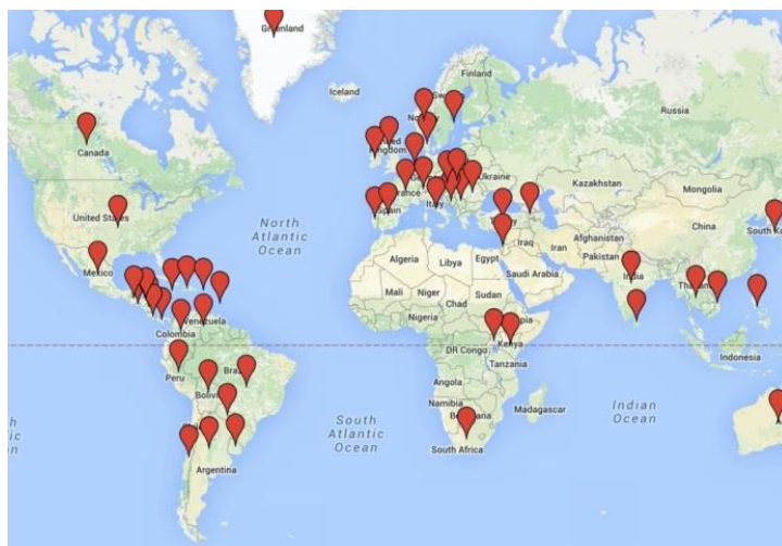
1. ábra Az El Sistema rendszer által ihletett programok helyszínei a világban (ábra: Kecskés D.-Vértesy Júlia 11 )

Az El Sistemát megismerve egyre több országban kezdték el alkalmazni a csoportos zeneoktatást, a zenekari zenélés eszközt szociális nevelés céljából. A világon ma 55 országban összesen 237 program kötődik az El Sistemához (lásd az 1. ábrán).