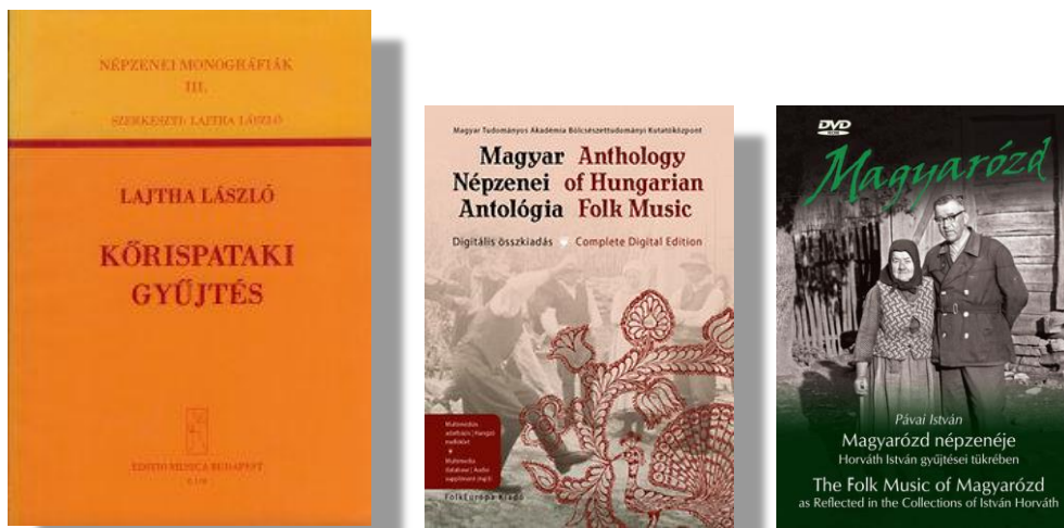
3. ábra. Népzenei tematikus kiadványok

a) Tematikus (egy régiót, előadói vagy kutatói személyiséget, hangszertípust vagy programot bemutató) kiadványok, amelyekben a hozzáadott pedagógiai tartalom minimális. Tematikus anyagokból sok áll rendelkezésre (például Lajtha 1980, Richter 2012, Pávai 2015), viszont nem fedik le a teljes magyar nyelvterület zenei hagyományát.