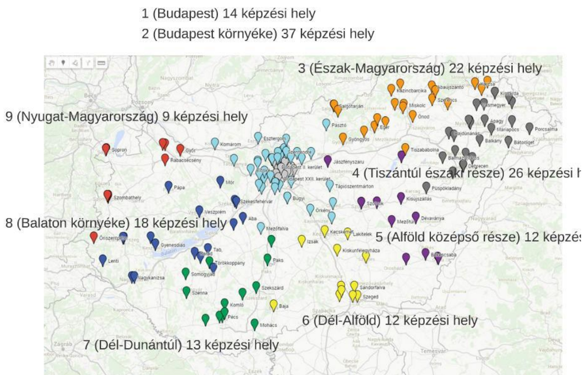
2. ábra. A kutatás helyszínei

Az oktatási helyzet felmérése során mintegy 150 iskolát, az ország szinte valamennyi népzenei szakirányt működtető intézményét felkerestük. 3 A 2. ábra a felkeresett képzési helyeket körzetenként jelöli, a színek egy-egy körzetnek felelnek meg. 4 Az ábra szerint a legtöbb iskola Budapesten és környékén található, még jól ellátottnak tekinthető az észak-magyarországi térség. A többi területen, megközelítőleg egyenletes eloszlásban, körülbelül feleannyi iskola működik. A kutatás során rögzítettük az iskolák népzene tanszakának általános leíró adatait: a tanszakvezetők és szakirányfelelősök végzettségét, a tanulók számának alakulását, valamint az infrastrukturális adottságokat. Módszertani szempontból felmértük az általánosan használt és helyi gyakorlatot, az alkalmazott általános kerettantervet és helyi tantervet, tanáronként az adott szakirányhoz kapcsolódó, részletesebb adatokat. Végül meghatározott szempontok alapján összefoglaltuk a tendenciákat, a hiányokat és előnyöket, figyelembe véve a tanulók előadási és versenylehetőségeit, valamint a tanártovábbképzés helyzetét.