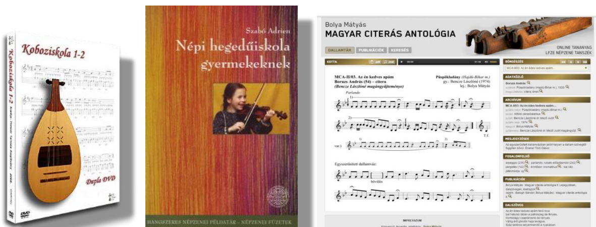
5. ábra. Korszerűnek tekinthető tananyagok