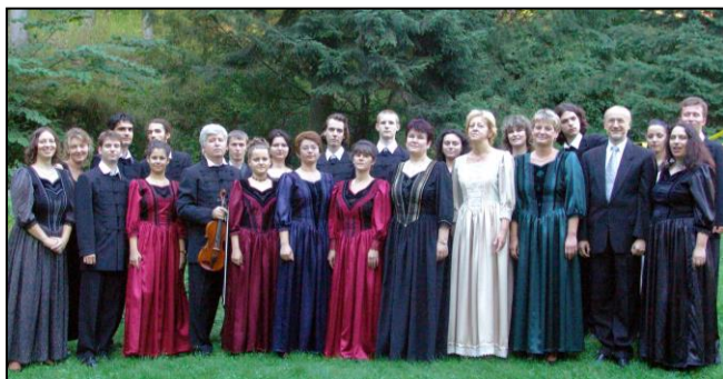
Lavotta János Kamarazenekar

Napjainkban az alapítvány feladatait teljes körűen jogutódja, a