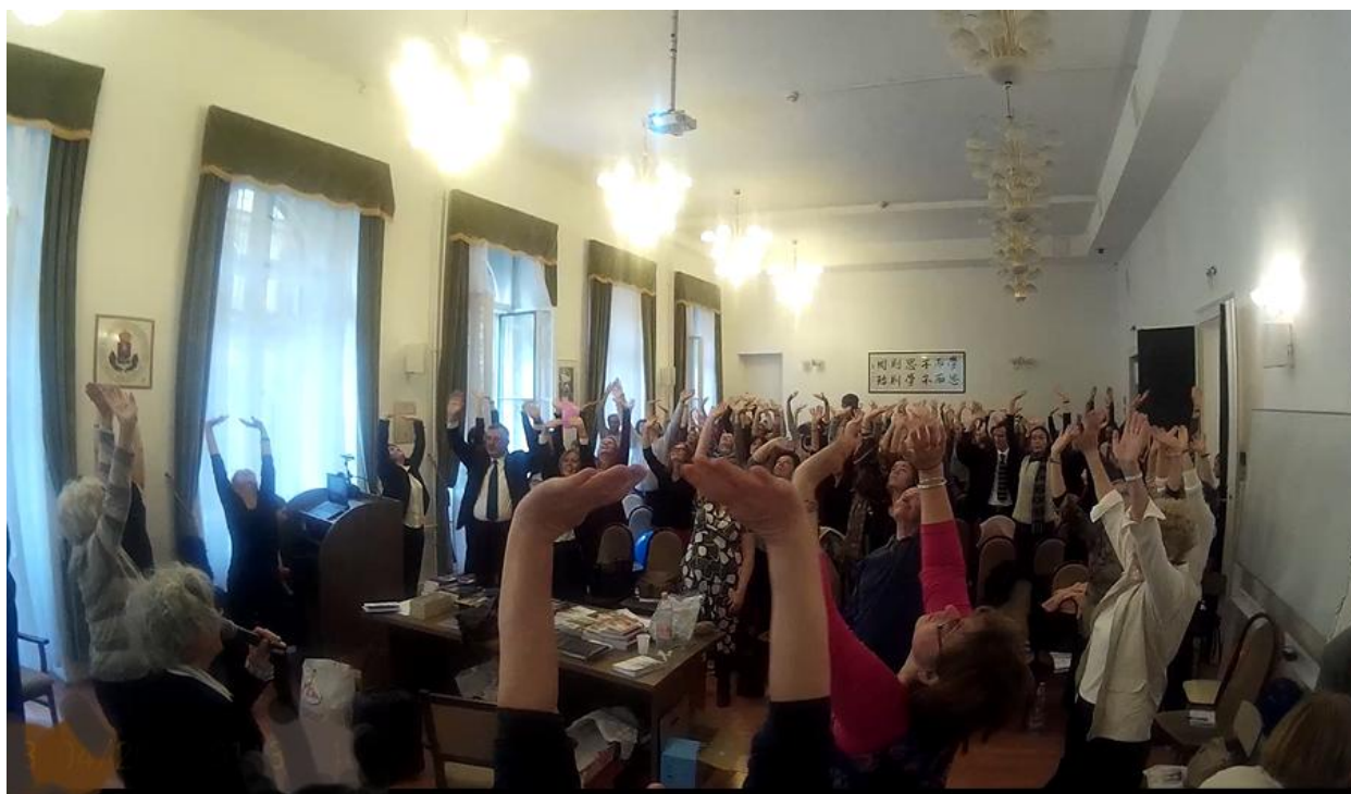
Frissítő mozgás a konferencia résztvevőinek