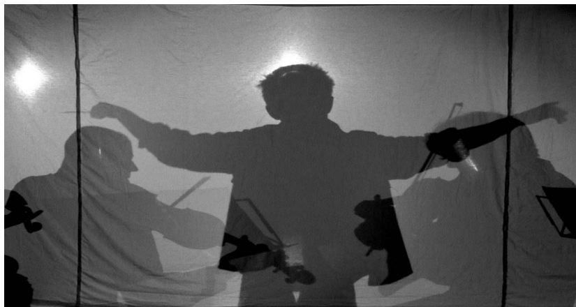
„Kis karmesterek” program

E programrész fő célkitűzése a diákok kezdeményezőképességének és vállalkozókészségének fejlesztése vonósnégyes munka által inspirált kreatív produkciókon keresztül. A vonósnégyes, a legrepresentatívabb kamarazene műfaj működésének alapja a csapatmunka. A hangszerek közötti folyamatos párbeszéd, a fontos szólamok előtérbe helyezése és a kísérő hangszerek halkabb játéka a kamarazenélés lényege, mely üzenetnek a zenei kreativitás fejlesztésében fontos szerep jut. A túlnyomó részt zeneiskolai tanulmányokat nem folytató tanulóknak a vonósnégyessel végzett közös munka során alkalmuk nyílik arra, hogy kis „zenekart”, egy vonós kvartettet irányítsanak.