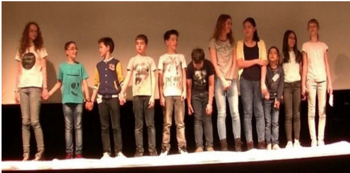
A Budapest III. Kerületi Krúdy Gyula Angol-Magyar Két Tanítási Nyelvű Általános Iskola diákjai

Fejlesztendő ismeretek: színjátszás; forgatókönyv készítés; zenei dramaturgia; a tanulók személyiségének, egyéniségének megismerése, azonosítása a választott szerephez; árnyjáték világítástechnika; színpadtechnika; kameratechnika;