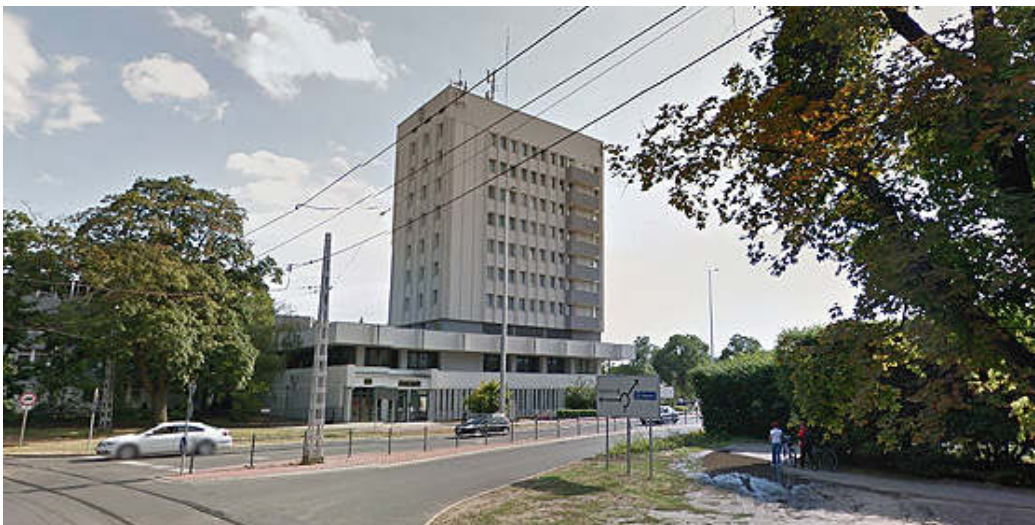
A Debreceni Egyetem Zenei Karának épülete