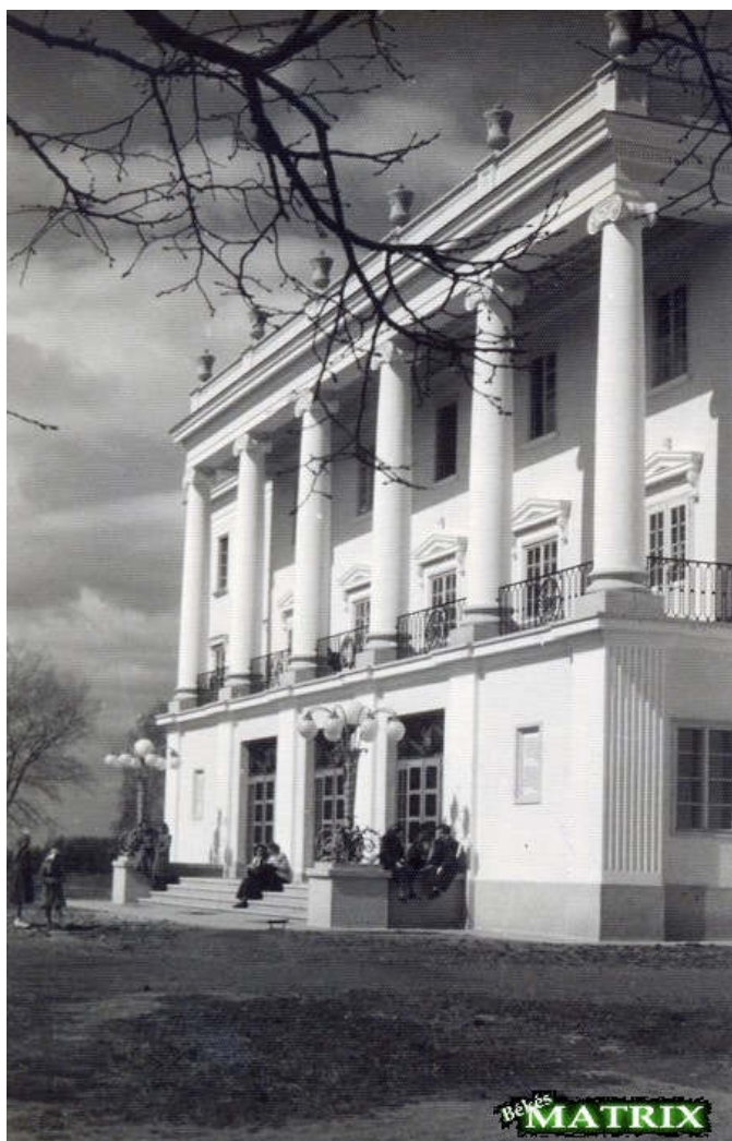
A békés-tarhosi iskola épülete, a korábbi Wenckheim grófi kastély

ahol gyakorlatban megvalósították a Kodály Zoltán által elképzelt zenepedagógiát. Eleinte csak egy zongoratanárnő volt, később, ahogy bővült a tanulók létszáma, megjelentek a különböző hangszeres tanárok. (A tarhosi évek alatt döntötte el, hogy korábbi elképzelésével ellentétben mégis zenetanár és karvezető lesz belőle.)