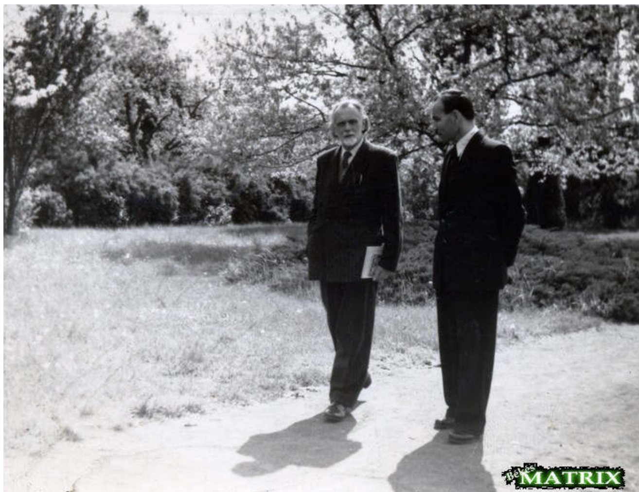
Kodály Zoltán és Gulyás György Békés-tarhoson

később, az iskolareform során, zenegimnázium lett. Az iskola célja az volt, hogy felkutassa a vidéki tehetséges gyerekeket és tanulási lehetőséget biztosítson számukra. Gulyás György így írt az iskola céljáról: „...az énekiskola hivatása lenne, hogy zenei önképzőkörök, népi játékok, balladák, mondókák alakítása és meggyökereztetése útján szinte alapépítkezést végezzen az egészséges, helyes zenei gondolkodás kialakításához.”(Gulyás 1988 p.25.) 2