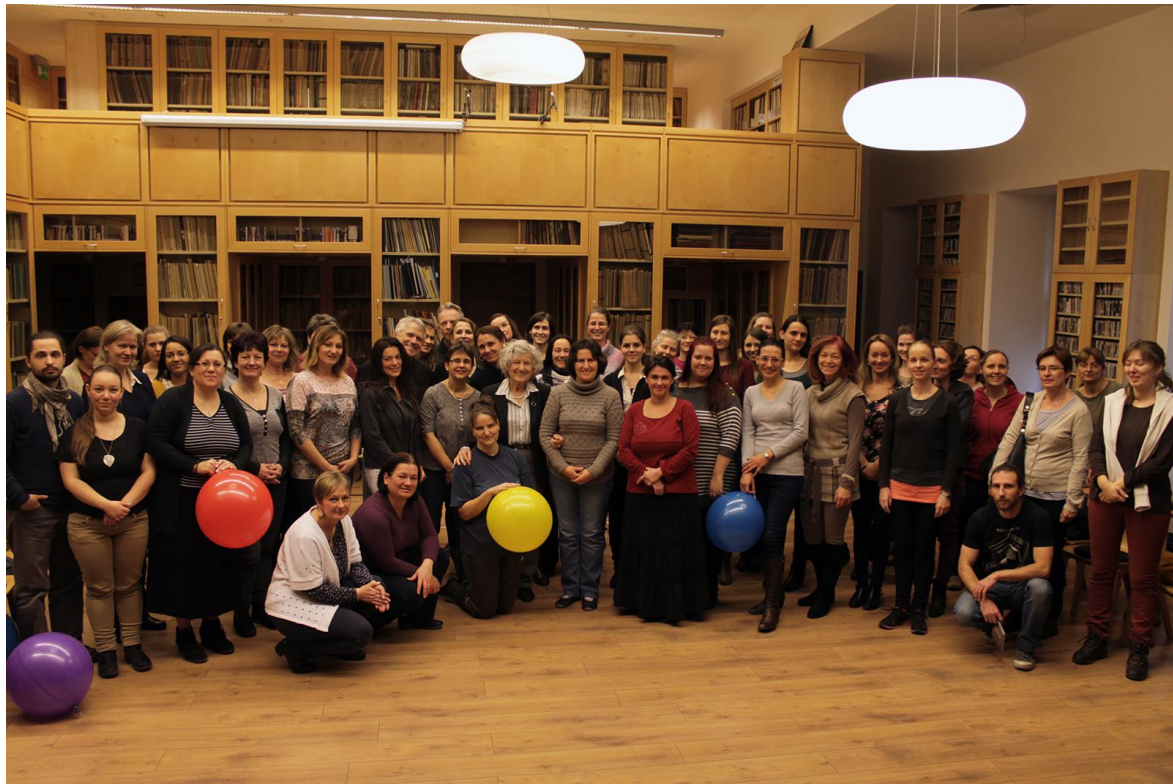
A februári találkozó résztvevői a BMC-ben

Közel 150 kolléga vett részt a zenei munkaképesség-gondozás (ZMG), vagy másképpen Kovács-módszer idei ötrészes továbbképzés-sorozatán, mely – mint egy öt tételes szvit – egészében és részenként is hallgatható volt. Egy-egy alkalommal 60-70 résztvevő jött el a Budapest Music Center és a Lajtha László Zeneiskola helyiségeibe. Kivételes pillanatokkal ajándékozott meg bennünket a Kurtág házaspár, akik egyik alkalommal ellátogattak hozzánk, és velünk töltöttek egy kis időt. Ők a ZMG programnak mind a mai napig hívei és példaadó résztvevői.