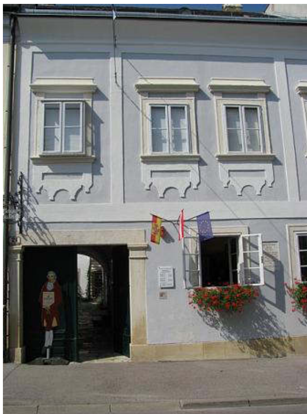
A kismartoni Haydn-ház Ausztria egyik leggazdagabb zenei emlékhelye. 1766-1778 között Haydn otthona volt

A nyugat magyarországi Kismarton (ma: Eisenstadt, Ausztria) és Eszterháza, a hercegi szolgálat fő színterei, Bécs közelségével, Európa számos fontos irányzatát közvetítő légkörével, ideális háttérrel jelentettek a Haydn-formátumú alkotóművész számára. Maga a zeneszerző így jellemezte helyzetét: