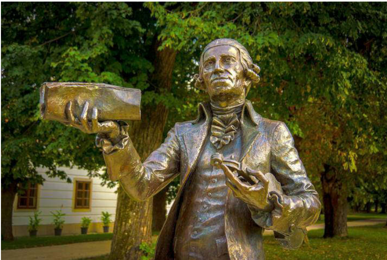
Joseph Haydn Eszterházán

( www.zetapress.huhttps://www.google.hu/search?tbs=simg%3A%00&tbnid=dQySEhPKanSfoM%3A&docid=mnb5w9BAtjwAyM&bih=557&biw=1152&tbm=isch )