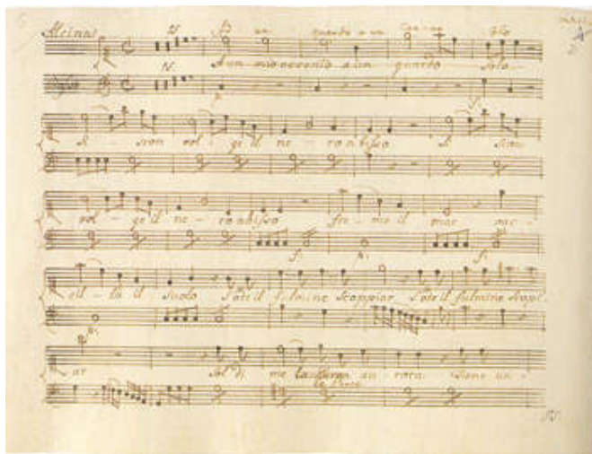
Joseph Haydn (1732-1809): Orlando Paladino - Alcina áriája. - Korabeli szólammásolat 1782-ből, az Esterházy-archívum kottatárából ( Országos Széchényi Könyvtár )