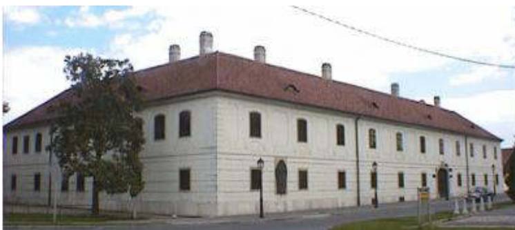
Esterháza, Muzsikaház

A négy egymást követő hercegi gazda műveltsége, ízlése, lelki alkata alapján eltérő kötelezettségeket rótt az időközben európai klasszissá felnövő zeneszerzőre: 1790 után Haydn és az Esterházy-család kapcsolata egyre inkább formálissá vált. Mégis, egy pillanatig sem lehetett kérdéses, hogy a londoni szimfóniák, vagy a Teremtés és az Évszakok szerzője végakaratóban a hercegi házat jelöli majd meg szellemi hagyatéka kedvezményezettjeként.