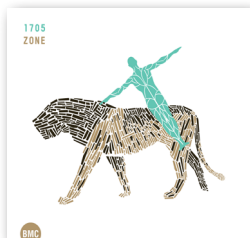
BMC CD 221 1705 Zone

Néhány korábbi album a BMC Records gondozásában, a trió egy-egy tagjának közreműködésével: