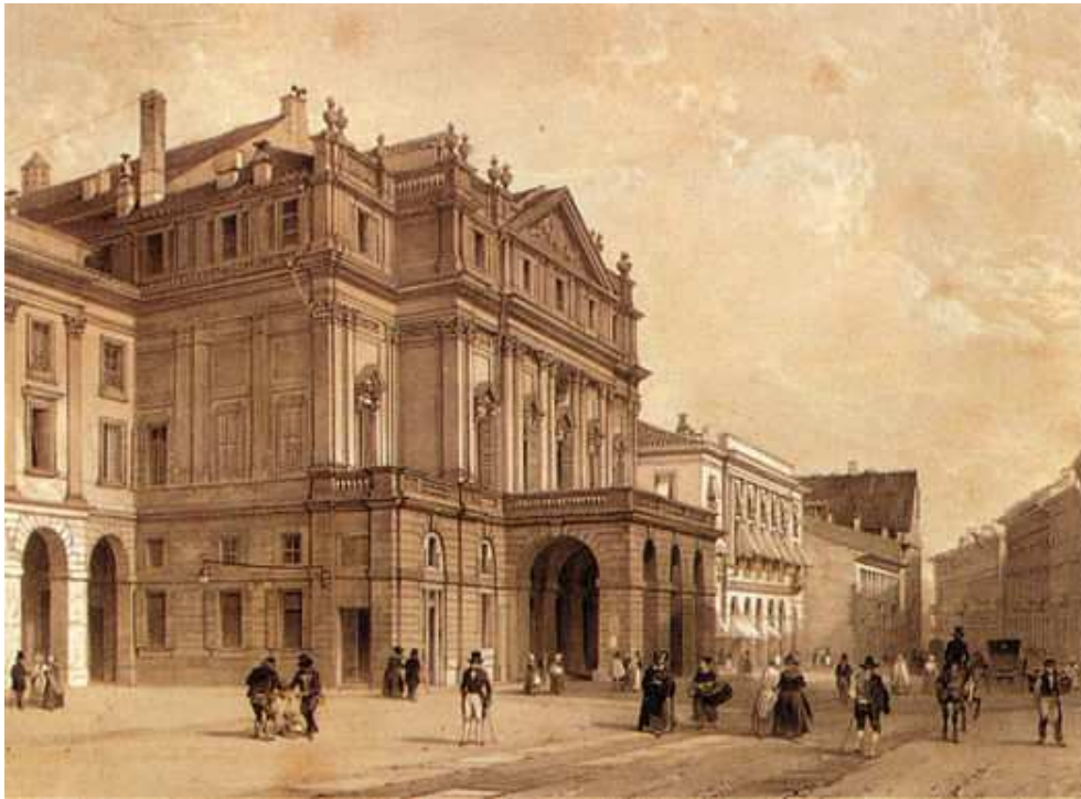
A Scala a 19. században

előadás vezénylésére is. A művet 1834. májusban adták elő a Teatro Filodrammaticóban. Ezután Pietro Massini opera komponálására kérte fel Verdit.