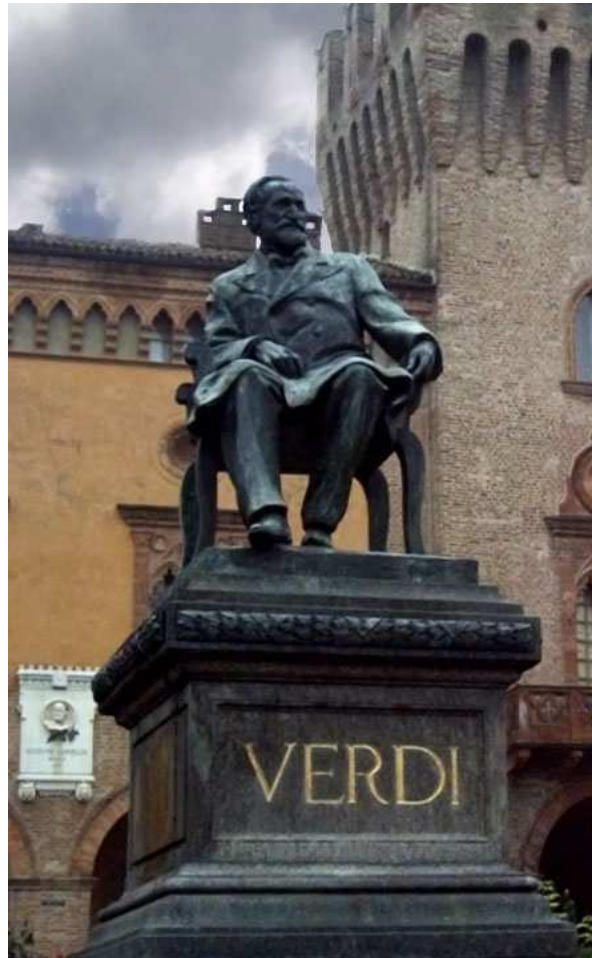
A Piazza Verdi, Busseto főtere, a komponista szobrával

emellett az anyakönyvi utalás sem helyes, hiszen olasz nyelvű név bejegyzésre hivatkozott. A Szabolcsi Bence-Tóth Aladár (1967) Zenei lexikon is az október 10. dátumot jelölte meg.