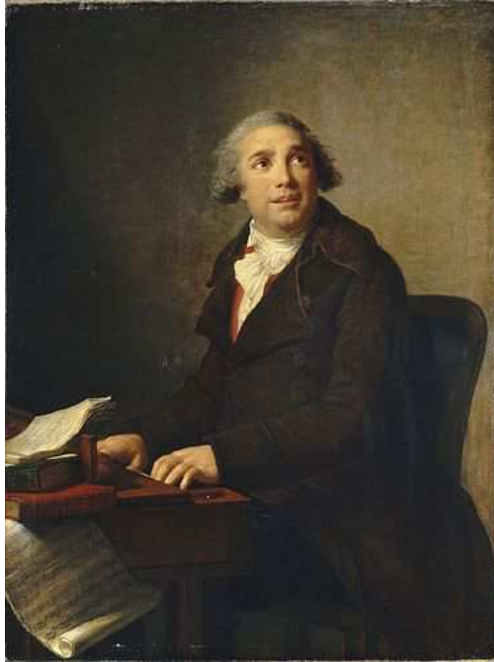
Paisiello a csembaló előtt, Marie Louise Élisabeth Vigée-Lebrun festménye, 1791

Milánóban a konzervatórium tanára és a Scala betanító karmestere volt. Verdi a következőkben számolt be tanulmányairól egy levélben: „Lavigna igen erős volt ellenpontban, s egyben kissé tudálékos. Paisiello zenéjén kívül nem igen becsült más zenét. Emlékszem egyik nyitányomat áthangszerelte Paisiello stílusában (attól kezdve nem mutattam meg neki egyetlen darabomat sem). A vele töltött három év alatt nem csináltam mást, csak a legkülönbözőbb kánonokat és fűgákat. Senki nem tanított nekem hangszerelést, vagy azt, hogy hogyan kell bánni a drámai zenével”. (Budden 2007. 17.p)