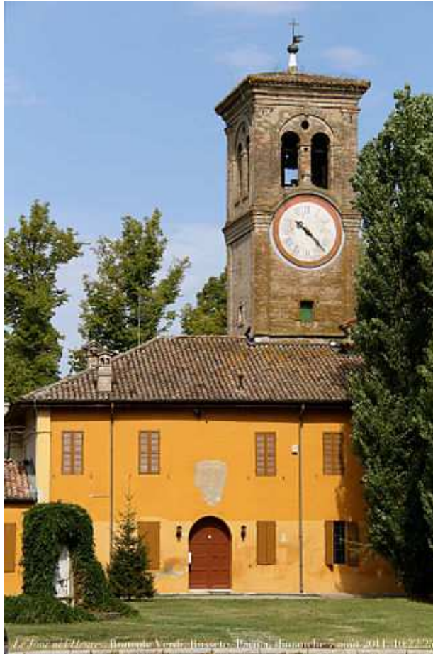
A San Michele Arcangelo templom Le Roncolében