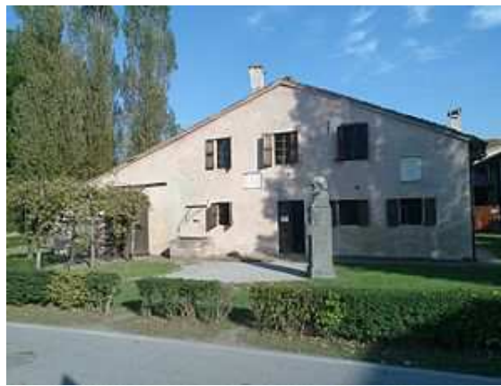
Verdi szülőháza Bussettóban