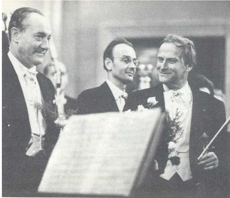
Egy ÁHZ-s koncert után: Ferencsik János, Szilvássy László és Yehudi Menuhin

Emlékszem, egyszer már ÁHZ-s kollégák voltunk egy lemezfelvétel szünetében az egyik fiatal csellista egy technikailag nem nehéz, de kissé váratlan harmóniákkal teli passzázst gyakorolt nagy-nagy buzgalommal, ám az nemigen javult. Erre Laci bácsi némi malíciával, de inkább tréfásan odaszólt: nem fizikai, szellemi munka!