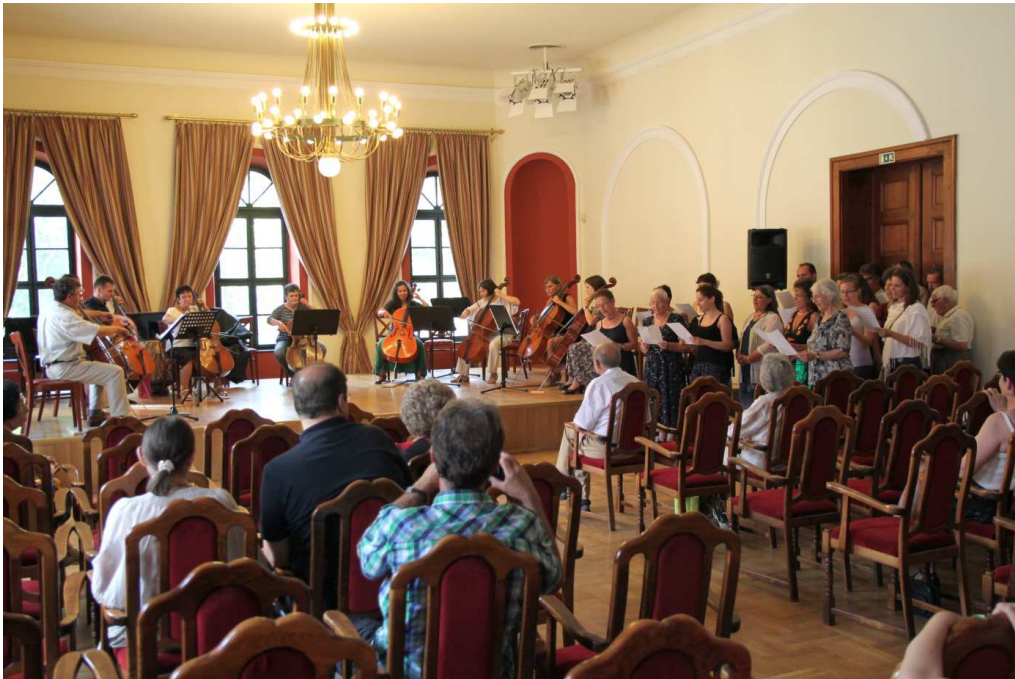
Egykori tanítványok 90. születésnapjára köszöntője gordonkán és énekhangon az Óbudai Társaskörben