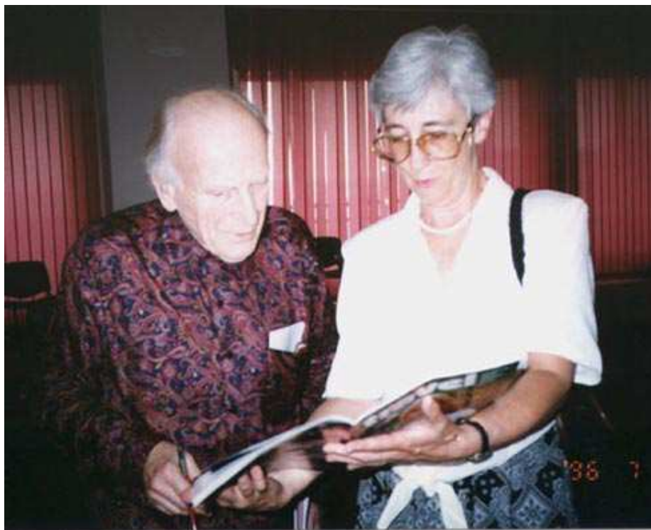
Lord Menuhin és Csébfalvi Éva (OFI)