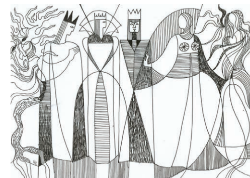
Bartók: Der holzgeschnitzte Prinz Éva Rab-Kováts