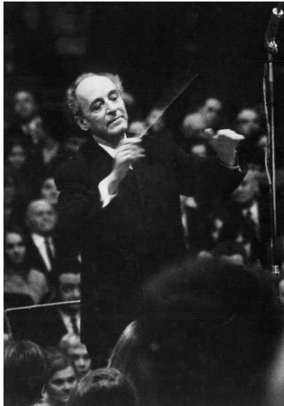
Bárdos Lajos (Híres magyarok - Network.hu)