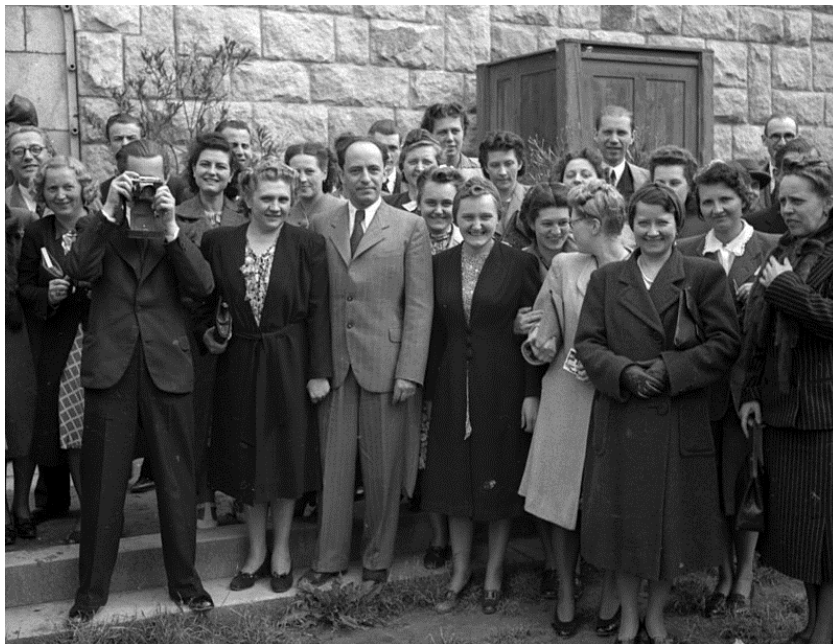
A Budapesti Cecília Kórus, közepén Bárdos Lajos (1941)