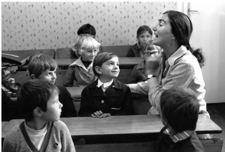
Kókás Klára kecskeméti gyerekekkel, 1976, (NOL.hu)

Az óvodában és kisiskolás korban napi gyakorlattá tett éneklés, gyermekjáték természetes módon válik részévé a gyerekeknek. Az iskolai kóruséneklés nem elvesztegetett idő, hanem egy értékteremtő és bármely iskolai alkalmat gazdagító tevékenység lehet. Ezt elsősorban vezetői szinten kellene elfogadni és megérteni, mert a hiányzó támogatói közegben megrekedhet még a legkiválóbb pedagógus is.