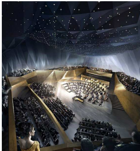
A tervezett akadémiai koncertterem digitális képe

A tervezett új akadémiai épületek zöld növényekkel borítva. A háttérben fent a királyi vár (Wawel) sziluettje fénylik, balra a Visztula.