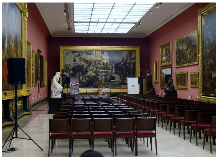
1956-os ünnepség és a 2016/17-es Magyar Kulturális Év megnyitása