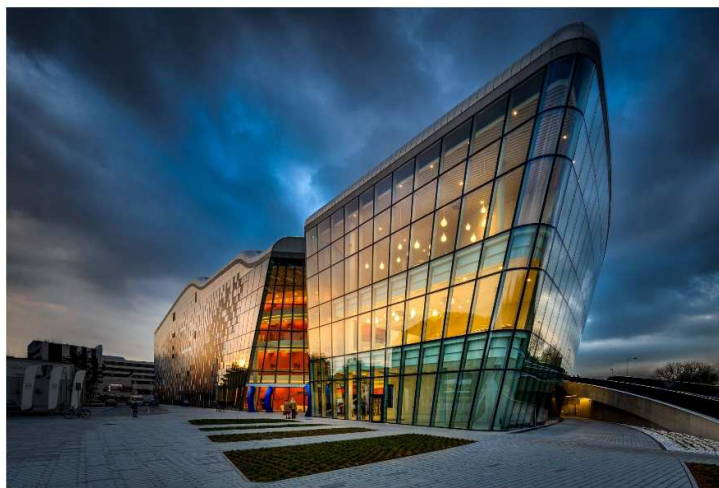
A homlokzati rész a Visztula partján