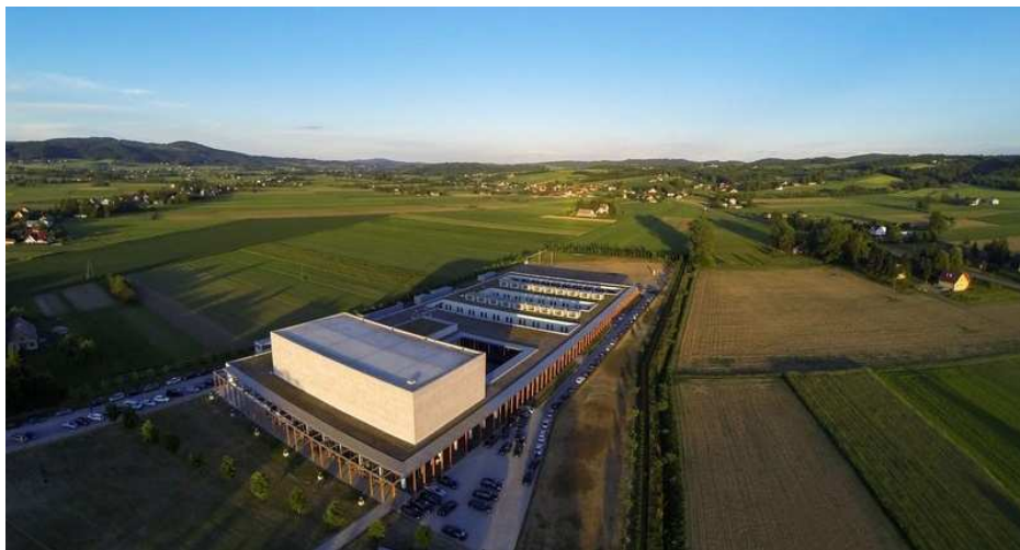
A centrum madártávlatból