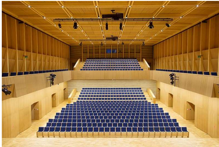
Koncertterem a Centrumban

Az ICE Kraków Kongresszusi Központ a város egyik üzleti és kulturális zászlóshajója. A Wisztula ( Wisła ) partján, a Wawel királyi várral szemben fekvő épület szinte bármilyen eseménynek képes otthont adni a nemzetközi kongresszusoktól és konferenciáktól kezdve a zenei rendezvényeken, koncerteken át a legkülönfélébb kulturális előadásokig, legyen az opera-, balett- vagy színházi előadás.