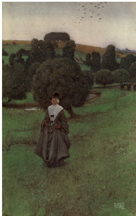
Eleanor Fortescue-Brickdale illusztrációja

Scarlet városában, ahol születtem, élt egy lány. Minden fiút megríkatott; úgy hívták Barbara Allen. Május havában, amikor minden zöld bimbó duzzad, halálos ágyban az ifjú Jemmy Grove Barbara Allen iránti szerelme miatt.