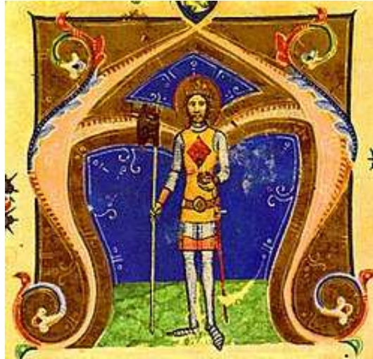
1. ábra: I. László ábrázolása a Képes Krónikákban

„Idvezlégy, kegyelmes Szent László király, 1 Magyarországnak édes oltalma, Szent királyok közt drágalátos gyöngy, Csillagok között fényességes csillag.