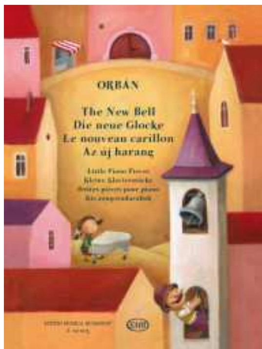
(Editio Musica Budapest Z. 20 003)

Orbán György zongoradarabjaiból jelent meg új album a közelmúltban, mondhatni, „beharangozásaként” a szerző 71. születésnapjának.