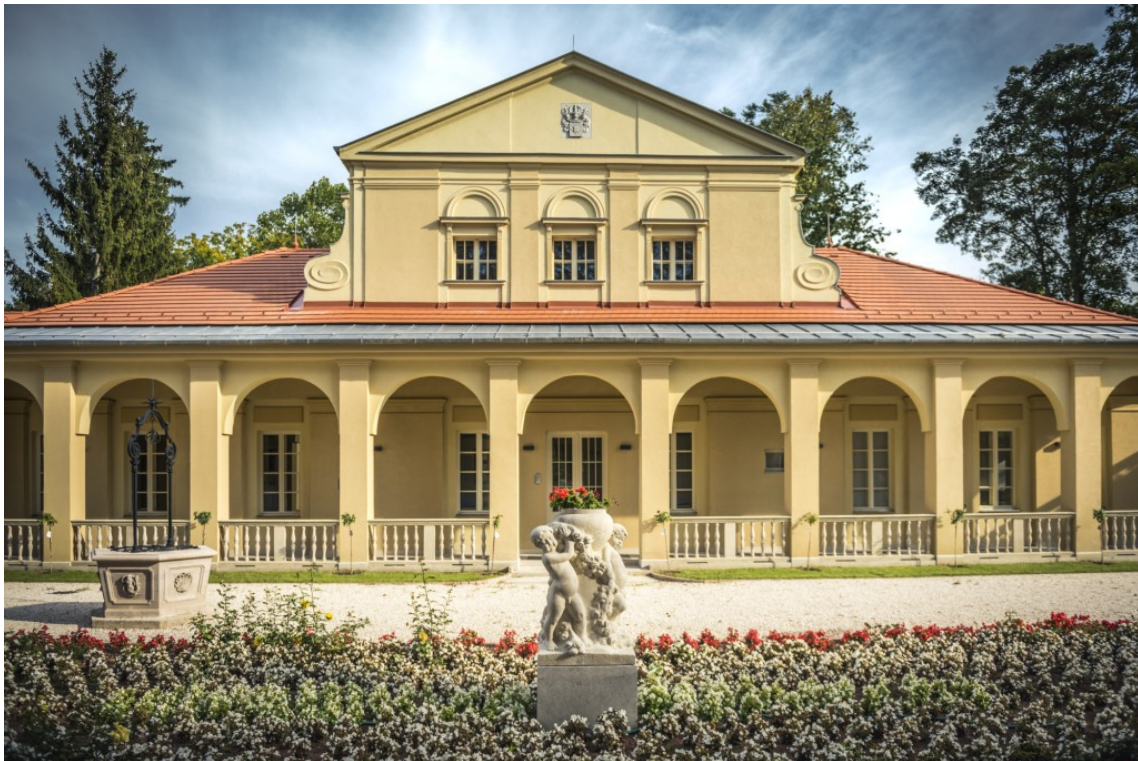
Klebelsberg-kastély (Emlékház, Galéria)