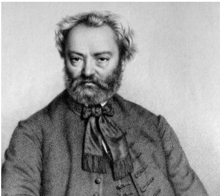
Erkel Ferenc ( Szin haz.hu )

Az Erkel Ferenc Társaság (5700. Gyula Városház utca 13., Adószám: 19061089 - 1 - 04 Bankszámla-szám: MKB Bank Zrt. 10300002-10631288-49020011) 2018-ban saját bevételein (tagdíjak, pénzügyi kamatjövőírás) felül az EMBERI ERŐFORRÁSOK MINISZTERIUMA, GYULA VÁROS ÖNKORMÁNYZATA, a MAGYAR MŰVÉSZETI AKADÉMIA, valamint az EMBERI ERŐFORRÁS TÁMOGATÁSKEZELŐ - NEMZETI KULTURÁLIS ALAP államtitkári kerete támogatásában részesült a művészeti szakterületén ellátott szakmai munkájának, illetve működésének segítése céljából. A támogatásokat az Egyesület a pályázataiban benyújtott költségtervekben meghatározott módon, a pályázati célok tényleges megvalósítására használta fel.