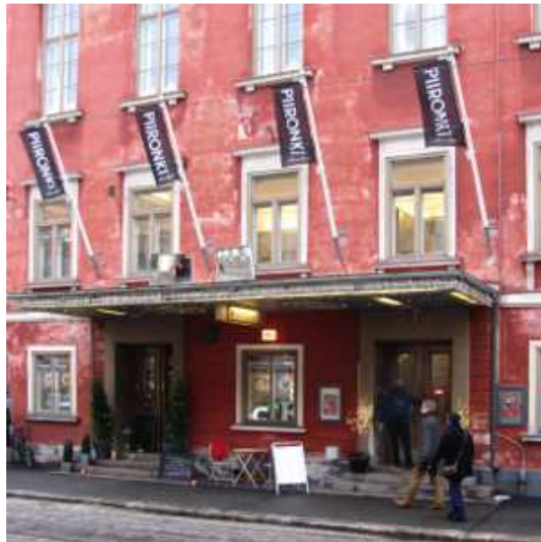
Balder terem helye

Március 6.-án este Helsinkiben, az un. Balder teremben (Aleksanterinkatu 12) kamarakonzert volt.