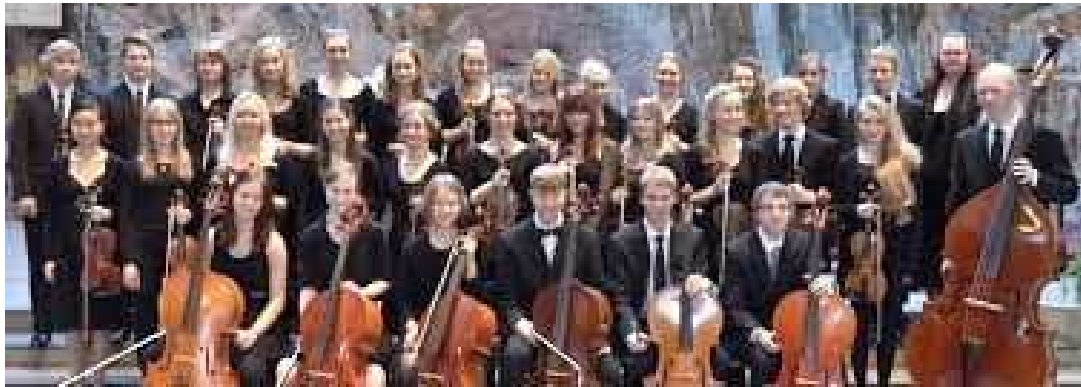
Juniorjouset – Fiatalok vonószekara

Ezen a hangversenyen fellépett a Kelet-Helsinki Zeneiskola Itätuuli = Keleti szél nevű ifjúsági fúvószenekara, az iskola ifjúsági vonószekara: Juniorjouset.