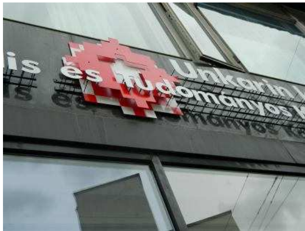
Magyar Kulturális és Tudományos Központ

Az ünnepi hét 2019. március 3. -án a Magyar Kulturális és Tudományos Központban (Kaisaniemenkatu 10) kezdődött.