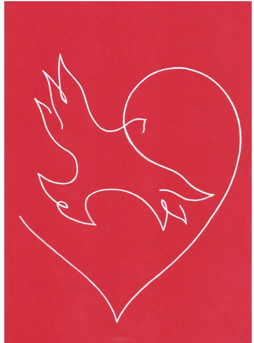
Szív és lélek

Lélek-fénnyel árad lelkem Szív-felhőben gyűlik könnyem S míg boldog-fájón földre ejtem Lelkedbe feledkezem.