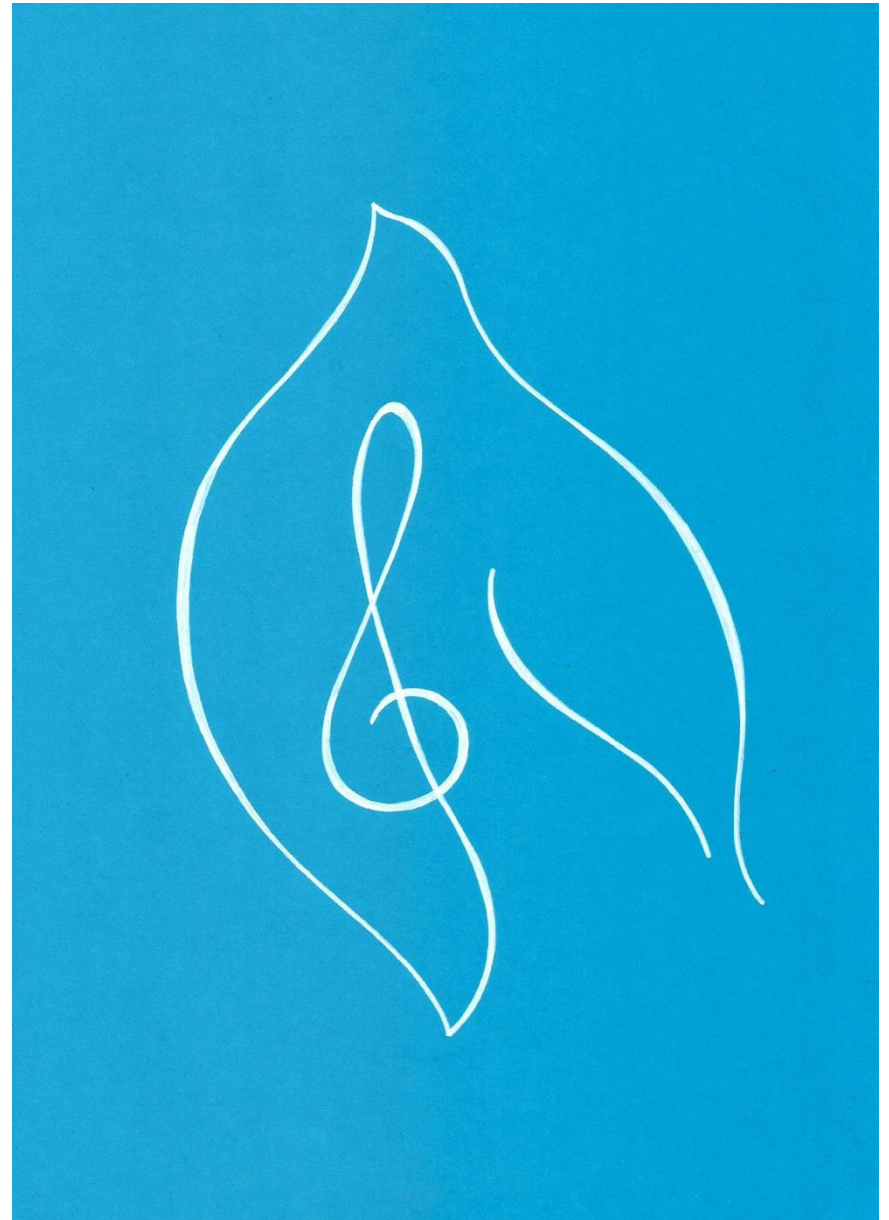
A harmónia lelke

Lelked puha palástja borul az estére Fényből szőtt bársony von takarót szívemre Csillag-magány oszlik, béke száll testembe Alkonyból lett sötét jötevőn fedez be.