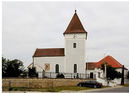
Gols (Gálos) kat. templom (G.F.Strattner szülővárosa)