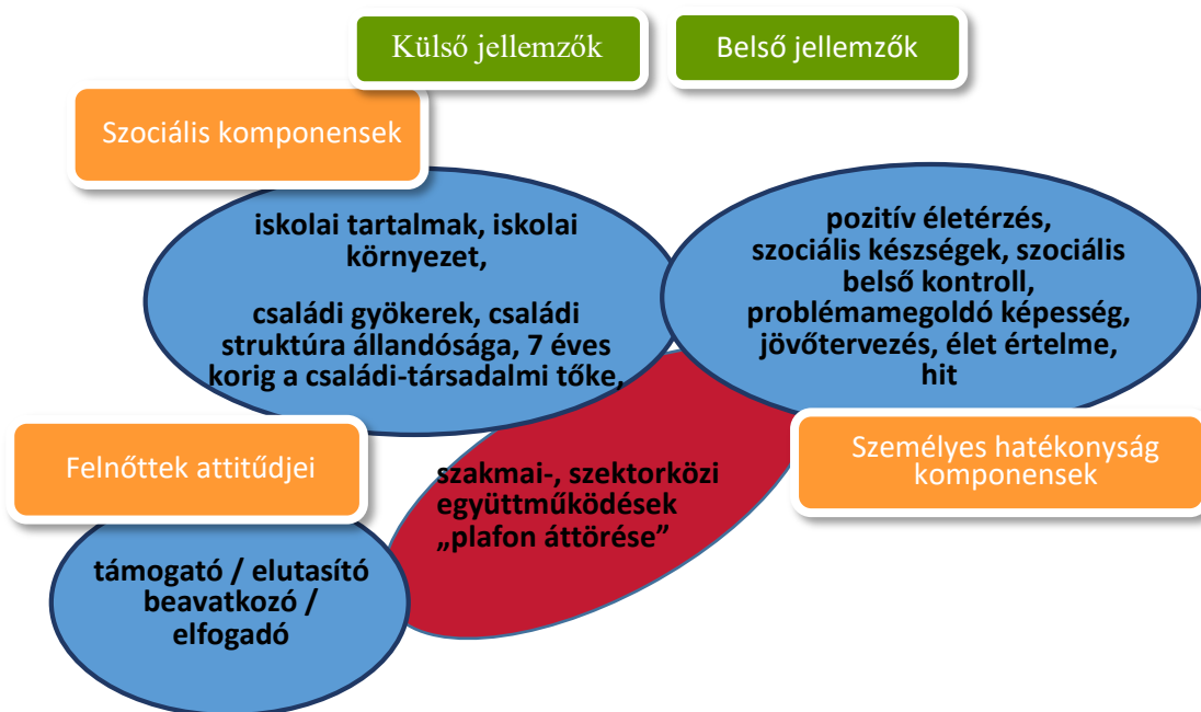
3. ábra. A gyermekvédelemben élő gyermekek rezilienciájának feltételezett meghatározó tényezői.

A kutatási eredményekből láthatóvá válik az összefüggés az iskolai környezet és az eredményes tanulás között. A vizsgálat fő eredménye az, hogy a rezilienciát az énhatékonyság érzése és az élet értelmében vetett hit erősíti a legjobban . Ezek kifejlesztésével a tanulók életminősége erősen javítható. A kifejlesztésnek a külső tényezői a szocioökonómiai előnyök, a valós kapcsolatok a tanárokkal, diákokkal, kortársakkal és a társas, közösségi élmények biztosítása, a belső pedig az érzelmi intelligencia (Bredács 2009, 2012), a problémamegoldó képesség (Bredács 2015), az autonómia, az önszabályozás, az önrendelkezés, a mások megnyerésére alkalmas képességek, a hit az élet értelmében, a valláshoz, hithez való vonzódás (Homoki, Czinderi, Segal, Sándor és Fodorné 2016). A leírtakat az 3. ábra foglalja össze.