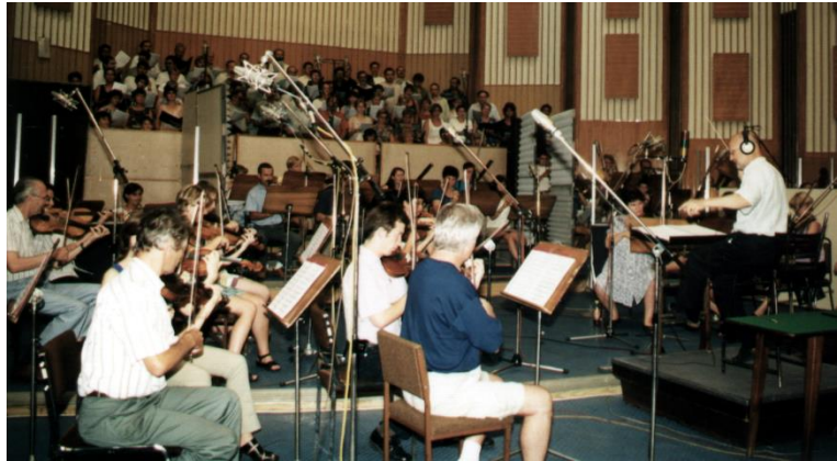
Felvétel a Magyar Rádióban