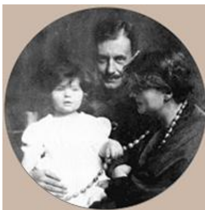
Manon Gropius, Walter Gropius és Alma Mahler

Sokat utaztak, és lángoló szerelem volt közöttük. Alma terhes lett Kokoschkától, azonban nem akarta megtartani terhességét, és titokban mesterségesen elvetélt. Kokoschka nagyon szeretett volna gyereket Almától, és annyira megharagudott a titokban végzett abortusz miatt, hogy megszakította a viszonyt Almával, noha egész további életükben kapcsolatban maradtak. Majd ismét felbukkant Gropius is. De kitört az első világháború, és mindkét férfi elment katonának. Gropius megsebesült, megkapta hősiességéért a vaskeresztet. Egy frontról történő eltávozás alkalmával elvette feleségül az özvegyet, aki később egy kislánnyal ajándékozta meg, akit Manonnak neveztek. A gyermek azonban később gyermekparalízisben megbetegedett, és megbénult, majd tizenéves korában meghalt. Ez a betegség nem fordul manapság elő a vakcinációnak köszönhetően.