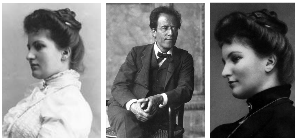
Alma Schindler 1900-ban és Gustav Mahler megismerkedésükkor

A sikeres évek után következtek az intrikák. Zichy Jenő gróf kormánybiztost ültettek az Operaház élére, mint intendánst, aki beleszólt a műsortervbe, Mahler hatáskörét meglehetősen megnyirbálták, és egyéb gáncsoskodások miatt felbontották a szerződést Mahlerrel, aki hatalmas összeggel távozott Budapestről, és világjáró művész lett. Ebben az időben még nem vált külön a zeneszerző és a karmester pozíciója. Mahler alkotó művész is volt, de az operaházi elfoglaltság mellett nem volt ideje komponálni. Noha az első szimfóniájának („Titán”) bemutatására Budapesten került sor.