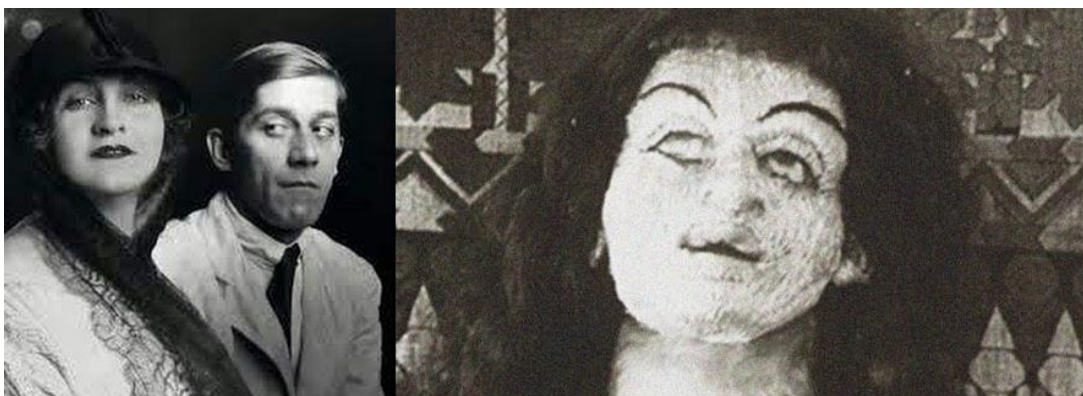
Alma Mahler és Oskar Kokoschka, valamint Almáról készült portréja ( Lewis Art Café )

Almának időközben újabb szeretője bukkant fel, Oskar Kokoschka (1886-1980) osztrák festőművész. Vele Mahler halála után három éven át élt együtt.