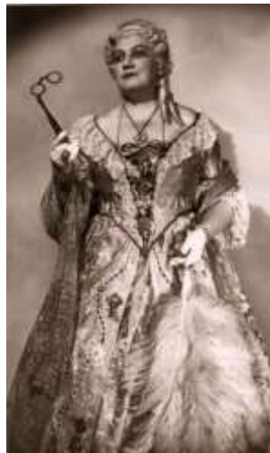
A Rózsalovag Tábournagynéjaként

Pályázása előtt elénekli még Wagner „Trisztán és Izolda” című operájának régen várt női főszerepét, Izoldát, majd Kodály: „Háry János”-ból a Császárné ízes, humoros figuráját. Hatalmas uborkásüveggel lép színpadra, kedves, népies kiejtéssel, mélyen zengő hangon mondta el szövegét, énekelte el szólamát. Finom bájjal kápráztatta el közönségét. Megmutatta, ő még erre is képes. Két ennyire különböző szerep, zárja be a kört. Egy hatalmas, be nem teljesült szerelmi drámát oldott fel egy kedves vígjátékkal, talán mert vidám képet szeretett volna hagyni maga után, akár Verdi, Puccini, a két olasz operakirály.