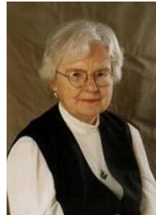
Szőnyi Erzsébet (1924)