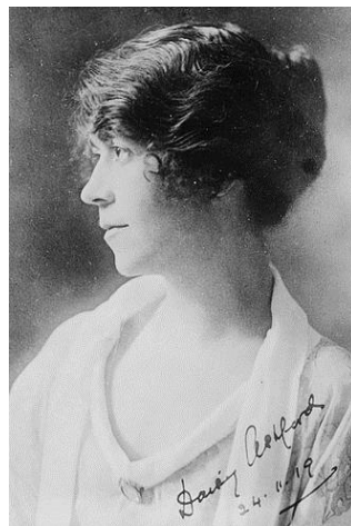
Margaret Mary Julia Devlin /Daisy Ashford/ (1881 – 1972) angol író

Christian Heinrich Heinekin kevésbé volt szerencsés. Korabeli beszámolók szerint néhány órával születése után beszélt, 3 éves korában latint, franciát, történelmet és földrajzot tanult, és megjósolta saját 4 éves kori halálát.