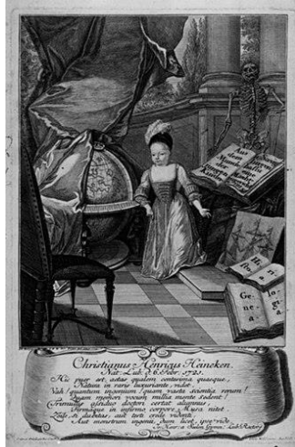
Christian Heinrich Heineken (1721 – 1725) német gyermektudós

A legismertebb csodagyerek Mozart, aki első szimfóniáit nyolcévesen komponálta, és évekkel azelőtt már Európa királyi házaiban zongorázott. Számos maradandó zeneművet alkotott.