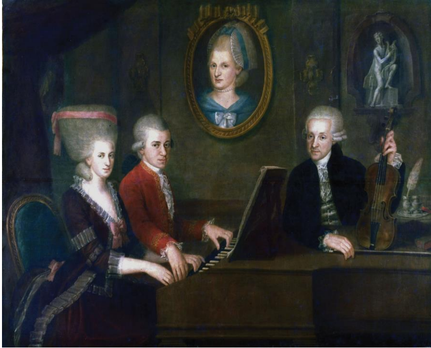
Leopold Mozart (1719-1787) és családja: a zongoránál Nannerl és Wolfgang