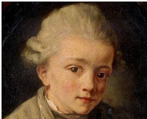
A gyermek Mozart, Greuze festménye 1763-1764 táján

Vitathatatlanul, a csodagyerekek a tehetség igazán ámulatba ejtő esetei. Olyan tudással rendelkeznek, amelyet az emberek nagyobb része egész életében nem ér el.