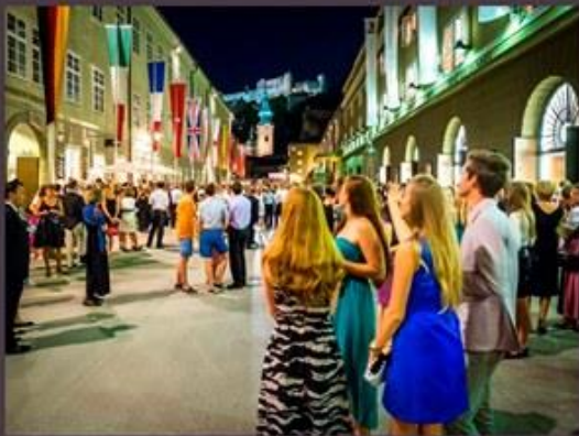
Hochstadlpassage - a világ legnagyobb koncert helye jó, jobb oldalán a Nagy Fesztiválszínházzal sál www.c.w. Gluck, Arndt, Schupbach, Sillkolevanda, 2009