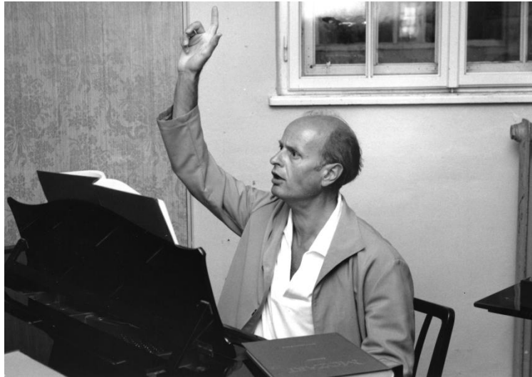
Fricsay Ferenc Mozart Idomeneo című operáját próbálja

találkozni. A mise ugyan szóba került, sőt később el is vezényelte, de amiért jött, az egész más volt: szüksége van egy titkárra – mondta –, aki sok nyelven beszél, ért a magyar történelemhez, zenéhez, tud kocsit vezetni, gépírni, és éjjel-nappal a rendelkezésére áll. Kissé szerénytelennek tűnhet, de elvállaltam a megbízást, csak hogy a kiadónál hat hónap volt a felmondási időm. Fricsay, aki lángoló