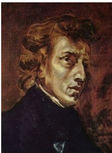
Delacroix: Chopin (Louvre Museum, Paris)

Forradalmi etűd, Appassionata, Téli vihar etűd – a tépettségnek, zaklatottságnak nem-szabályos rendbe foglalt hangjai: a szabályosság végső határai a dinamikában, a harmóniavezetésben, stb. (A legenda, hogy Chopin nem tudott hangosan zongorázni, legalábbis minden erejét össze kellett szednie a fortissimóknál, talán nem valótlan, azonban könnyen írt hangos zenét.) Ezekben az opusokban valami keresi a szabályosság határait, és nem valaki – ha a szerző maga tenné, a tudatosság zenéjéről beszélnénk, de az indulatáról beszélünk: kiáltáshoz, dadogáshoz hasonlóan képzi a szenvedély a maga alakját a zenében, amely a letétben mutat csak szabályosságokat.