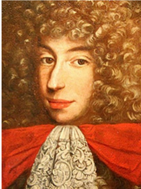
Ismeretlen alkotó: A. Stradella

Két ellentétes olasz barokk zeneszerző-portré: Carlo Gesualdo (Nápoly, 1566. március 8. – Nápoly, 1613. szeptember 8.) és Antonio Alessandro Boncompagno Stradella (Bologna, 1639. április 3. – Genova, 1682. február 25.). Az előbbi alkatánál fogva az érzelmek embere, a második a játéka és a hamisságé, az előbbi birtokol, utóbbi a máséra vágyik. Mennyivel nemesebb az első jellem, mennyire korlátoltabb is, milyen provokálóan és tékozlóan parttalan a másik. Gesualdo szerelmének és annak szeretőjének is gyilkosa lesz, Stradellát pedig meggyilkolják. Gesualdo élete végéig vezekel. A birtoklás szenvedélye és a szoknyabolond, csaló szenvedélye: milyen logikus és mennyire kísérteties, hogy az önemésztő szenvedély beteljesülése a még nagyobb önkínzás, a bűnös tévelygéseké : más álnoksága által elveszni.