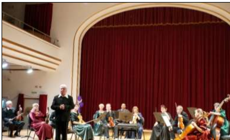
Enescu - Bartók terem pódiumán

A korabeli zenei élet nem csak a püspöki udvari egyházi zenét foglalta magában, de világi előadásokat is, koncerteket, színpadi és operaelőadásokat egyaránt. Mária Terézia, megelégtelve a vidéki város túlságosan fényűző, a püspöki székhelyhez nem méltó, kissé kicsapongónak tartott zenei életét, feloszlatta a zenekart, Patachich püspököt pedig áthelyeztette. Így ért véget a mindössze alig egy évtizeden át