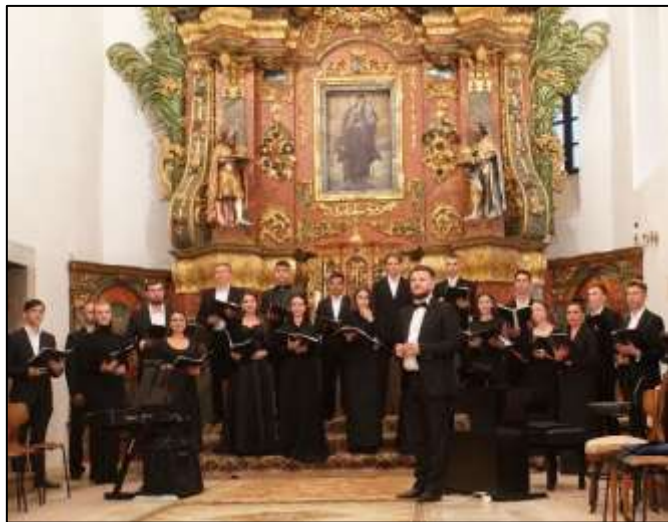
Munkács Város Kórusa a piarista templomban

kórusokra egyaránt kiterjed. Sátorlajújhelyben volt már szerzői estje, Márton Istvánnak 7 , Zádor Dezsőnek 8 és vendégszerepelt az Európa szerte ismert, Szakács Emil vezette Akadémiai Cantus Kórus. Legutóbb szeptemberben pedig Munkács Város Kórusát (művészeti vezető: Járószláv Bilicsko) látta vendégül a kamarazenekar. A közös munka eredményeként Korolenkó Ilona vezényletével Márton István miséje 9 hangzott el a pálos-piarista templomban. Kárpátalján mindig is méltó módon értékelték a művészeket, tudósokat, az értelmiség kiváló képviselőit, az általuk létre hozott épített örökséget, a kulturális értékeket, hagyományokat generációról generációra gondosan megőrizték.