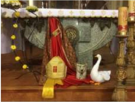
Úrasztal díszei a Szent Márton templomban