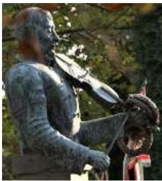
Gróf Fráter Lóránd szobra

Az elsősorban mezőgazdasági munkából élő érsemjéniek is ráérezhettek a verbunkos muzsika különlegességére, amely körülményre igazán illik Kazinczy közel 200 évvel korábbi erdélyi utazásának Nagyszeben tapasztalt zenei élménye, amelyről a következőt írja az Erdélyi levelekben: „ (...) muzsikusok gyönyörködteték füleinket a mi Lavottánk darabjaival, melyek szívet ragadnak, s a hajdani kor kedves darabjával, mely szívet nem kevésbé ragad, ahol talál, bár nem oly tanult. ” 5 Nos, elmondhatjuk, hogy a kamarazenekar előadása a Fráter Lóránd Kultúrházban valóban forró hangulatot teremtett. Az a figyelem, amely a zenetörténeti ismertetés során a műsorvezető felé irányult, a verbunkos darabok hatására a hallgatóság körében őszinte lelkesedéssel kifejezett vastapsban nyilvánult meg. A közönség szeretetét a kamarazenekar két ráadással hálálta meg.