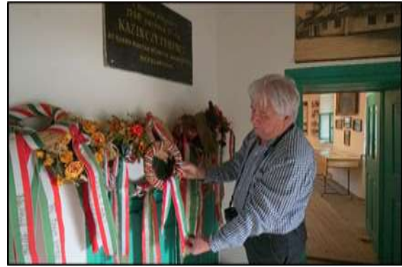
Kazinczy Ferenc emléktáblájánál

Ki ne ismerné a Kraszna Horka büszke vára, az Oda van a virágos nyár, s Ott, ahol a Maros vize messzi földön kanyarog kezdetű dalait?! Érsemjén neves fiainak emlékét monumentális köztéri szobrok is őrzik. Mindenesetre a "hely szelleme" a kamarazenekar tagjainak a koraesti hangverseny előtt kellő feltöltődéssel szolgált.