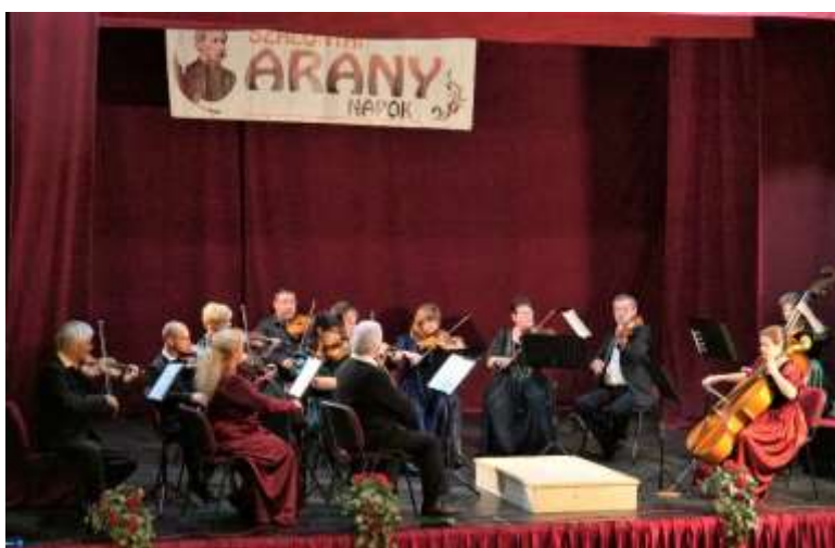
Lavotta János Kamarazenekar