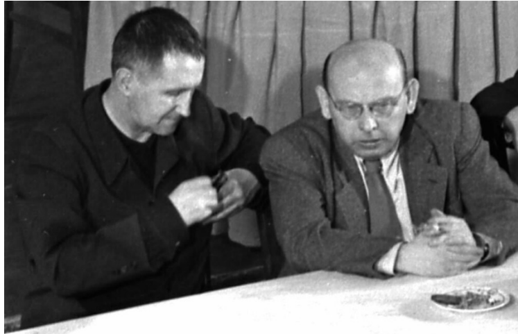
Bertolt Brecht és Hanns Eisler