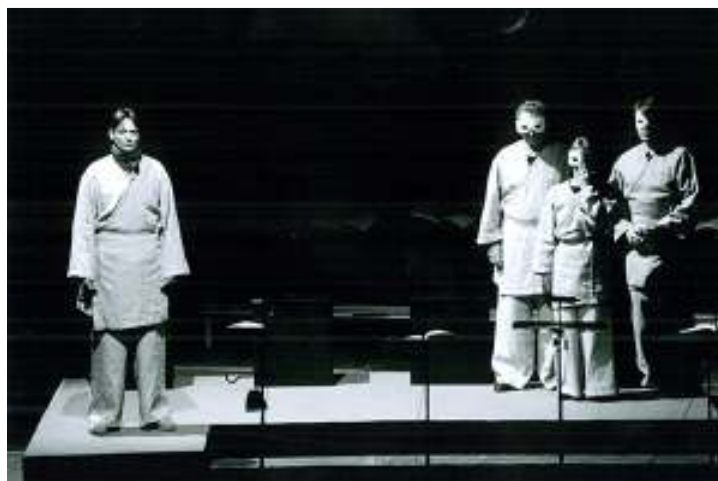
Az intézkedés – Dresden-Hellerau 1998.

A mű zenei tételei közül a legrövidebb 14 másodperc (Nr.6c), a leghosszabb több mint 9 perc (Nr.5). A tételek politikai meggyőzést szolgáló zenei karaktere sokféle: a szövegtartalomnak megfelelően találhatók közöttük szuggesztíven láttató (Nr.2a, 3a), agitáló (Nr.3b), profetikus (Nr.1), az epikus színházban megszokott módon elidegenítő (Nr.8) vagy mozgalmi induló (Nr.12b). Eisler jazz és szórakoztatózenei elemeket is középpontba állító 5 zenekarkezelése a komponista hollywoodi filmzeneszerzői tevékenységének stíluselemeit előlegezi meg. A tandróma zenei eredményei tovább élnek majd annak az Eislernek a filmzenéjében, akit 1940 és 1942 között a Rockefeller-alapítvány Filmzenei Programjának vezetésével is megbíztak. A Brecht színházi tapasztalataiból nyert téziseket is felhasználó program eredményeit Theodor W. Adornóval közösen írt, Composing for the Films című könyvében mutatja be Eisler. 6