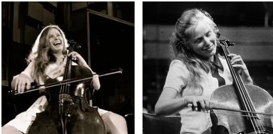
Jacqueline du Pré

Nagyon szeretetteljes volt a du Pré család. Apai ágon francia ősöktől származtak, az anyai ág régi angol eredetű volt. A testvérek összetartottak és a családban zenétől hangos, vidám hangulat uralkodott.