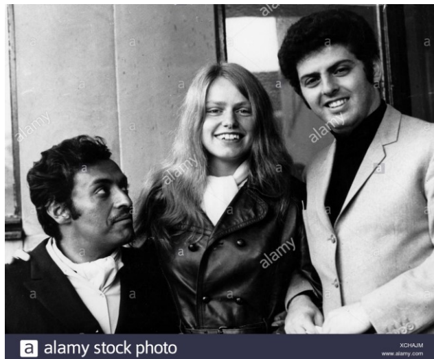
Zubin Metha, du Pré és Danuiel Baranboin

Vladimir Ashkenazy: Chopin - Etude Op. 10, No. 1