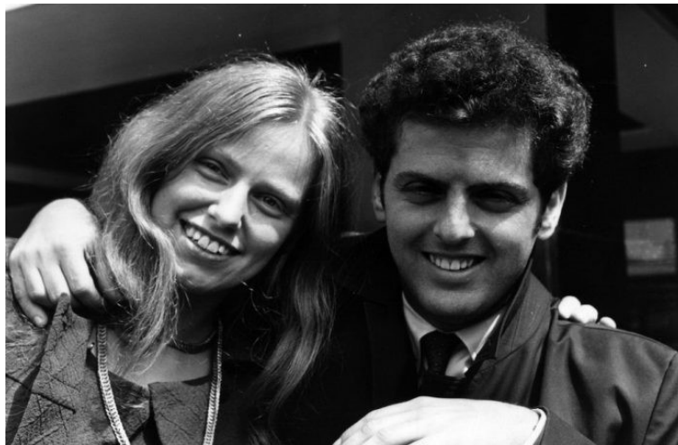
Jacqueline du Pré és Daniel Barenboim

Jacki művészi életpályájának kiteljesedésével egy időben egy másik csodagyerek is fantasztikus karriert futott be. Ez a művész Daniel Barenboim zongoraművész és karmester volt. Ő két évvel volt idősebb Jackinél. Mindketten hallottak egymásról, és végre New Yorkban személyesen is találkoztak. Nem kellett sokat beszélniük, leültek a hangszerükhöz, és azonnal értették egymást. Elsőpró szerelem volt. Danny ekkor a 26-ik, Jacki 24-ik évében volt. Sűrűn teleírt előjegyzési naptáruk lévén, hosszas egyeztetés után sikerült csak a családokat egymásnak bemutatni, és megszervezni, hogy legyenek közös fellépéseik szerte a nagyvilágban. Ők voltak akkor az „ arany pár ”. Mivel Daniel orosz-zsidó származású volt (Argentínában született), ragaszkodott hozzá, hogy Jacki vegye fel a zsidó vallást, és az esküvőt zsidó szertartás szerint Jeruzsálemben a Siratófalnál tartsák meg. Ez így is történt, nem sokkal a hatnapos háború után 1967-ben.