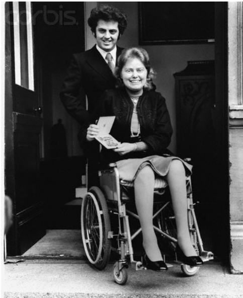
Jacqueline du Pré és Daniel Barenboim

Velük élt az édesanyja, aki nem tudta elfogadni az élet kegyetlen fintonát: a sors megajándékozta őt egy csodagyerekkel, akiből csodafelnőtt lett, az egész világ zenei életében ismert, ünnepezt művész, a legnagyobbak közül való, és ez a kivételes zenei zseni, hol lassabban, hol nekilendülve halad a kerekesszék felé. Fájdalma égbekiáltó volt. Képtelen volt beletörödni, hogy ezt a tüneményes tehetséget ő fogja temetőbe kísélni, és nem fordítva, ahogy ezt a természet általában rendeli.