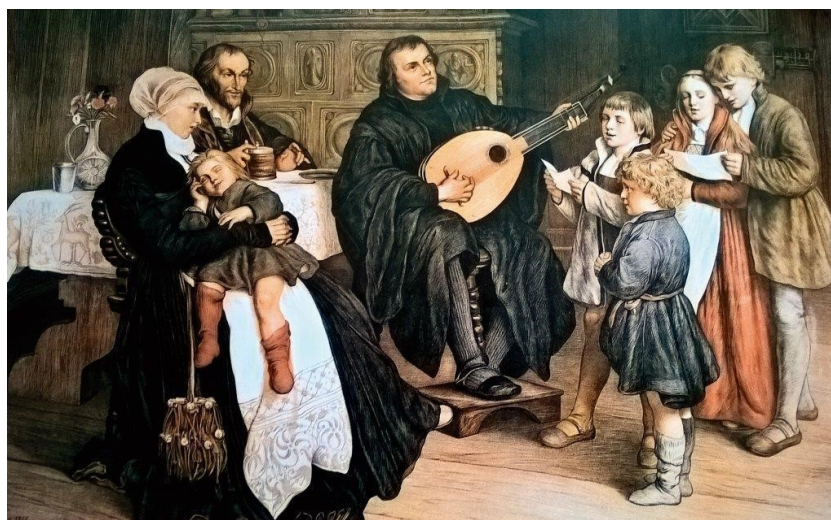
„Luther a zenének és az éneklésnek különösen nagy jelentőséget tulajdonított.”

Luther a zenének és az éneklésnek különösen nagy jelentőséget tulajdonított mind az egyéni, mind a közösségi hitéletben. Alapkövetelménynek tekintette, hogy a lelkészek és hitoktatók tudjanak és szeressenek énekelni. A reformáció 500. éves évfordulójára készülve fontos újra gondolnunk az egyházzene helyét és szerepét egyházunkban, kisebb-nagyobb közösségeinkben, családi és egyéni hitéletünkben. A kérdés fontosságát érezzük, mégis sok a tanácstalanság, mikor és mit énekeljünk, zenéljünk. Különösen is igaz ez a hitoktatásban. Mit tanítsunk? Hogyan tanítsunk? Milyen szerepet kaphat a zene, a népzene és az egyházzene az oktatásban, s hogyan viszonyulnak egymáshoz?