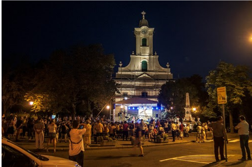
2019. augusztus 24-én ezen a helyszínen rendezték meg a XIX. Nemzetközi Gospel Fesztivált Solymáron. A Templom téren, a római katolikus templom előtt épített színpadon kilenc fellépő művész és zenekar mutatta be műsorát

Solymáron az évtizedeken át tartó nyári Bárdos Lajos-fesztiválok helyében már két évtizede csak „gospel” fesztiválok rendeznek. Ez a stílus az Istent dicsőítő zenék egyikeként fekete keresztény testvéreinknek sajátja New Orleans-ban és Afrikában. Mint a szentháromságos világ egy-egy jazz-ritmikai fogásokkal ékes, ősi érdekességét és sokszínűségét magunk is érdeklődve hallgatjuk. A jelenségben csupán a hazai egyházzene aránya, a „0” aggaszt kissé, mivel e történetben kiszorítva érezzük értékes népénekeinket, egyházi muzsikánkat.