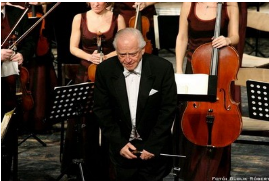
Peskó Zoltán a Pannon Filharmonikusok Wagner–Bartók-estje után a Művészetek Palotájában (2010. február 19.)

1983-ban jöhetett először haza vezényelni, de ettől fogva rendszeresen visszavisszatért. 1990 után hatalmas lelkesedéssel vetette bele magát a magyar zenei élet újjáalakításába. Sok nagyszerű hangversenyt vezényelt, pedig ilyenkor talán feszültebb volt, mint egy Scala premier előtt: a szülőföldjének, a honfitársainak akarta megmutatni, mit tanult meg nagyívű pályája során. Sok mindent elért, de sok mindent nem. A magyar zenei élet ritkán bocsájtja meg, ha egy honfitársunk külföldön csinál karriert. 2009-2011. között a Pannon Filharmonikusok vezető karmestere volt. Évekig vezette a szombathelyi Bartók Szeminárium karmester kurzusát. A budai Várban vett lakást, és egyre több időt töltött itthon. A róla készült portréfilmben ezt mondta: „Szerencsés ember vagyok, gyerekkorom óta azt csinálom, amit szeretek. Az én asztalomhoz odaült az Angyal.”