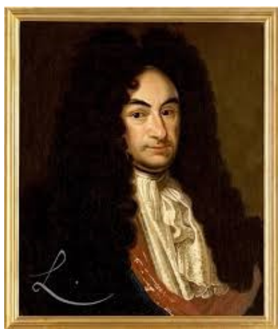
Immanuel Kant 1