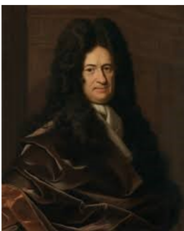
Gottfried Wilhelm Leibniz 2