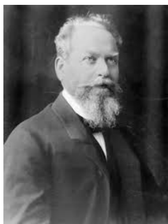
Edmund Husserl 3

Az idő csupán a világ érzékelésének egy-egy formája. Kant és Leibniz egyaránt úgy tekint rá, mint általunk kreált mérési rendszerre, egyetértenek abban, hogy az időt az elménk hozza létre: az idő eszerint nem szubsztancia – nem önmagában is megragadható létező –, szemben a newtoni idővel. Ennél még radikálisabban érvel Husserl: sem az idő, sem a tudat nem önálló szubsztancia.