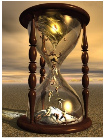
Az idő és az ember (Charoninstitute, WordPress.com)

Nem figyelmességből, nem is figyelmetlenségből, nem is idő hiányában. Itt nem mérik azt, ami nincs: a boldog időtlenség nem illúzió, felkiáltójel csak: épp a másik az illúzió (!), bár évezredek óta mérik homokkal, vízzel, a földre vetődő árnyék irányával, svájci órával és atomórával. Az itteniek kívül vannak az időn, sietnek a fogaskerekűhöz, felkaptatnak vele a hegy csúcsára: kivilágított kricsmik várják őket édes meleg italokkal és sörrel, szemben a fehér felhők ködében magasodó, mozdulatlan fehér sapkájú sziklák.