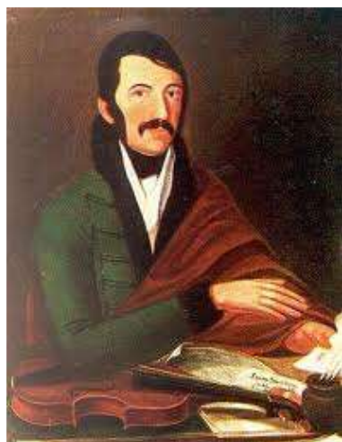
Ismeretlen festő: Lavotta János

Már korábban rámutattunk arra, hogy zeneszerzés és előadó-művészet mily kölcsönhatású Lavotta tevékenységében. Az iménti jellemzések után próbáljunk meg hegedűjátékához ezúttal a művek felől közelíteni. Ugyanis feltételezhetjük azt, hogy – a pedagógiai célú műveket leszámítva – olyan nehézségi fokú darabokat igyekezett írni, amelyeket valóban – különösebb gyakorlás nélkül is – virtuóz könnyedséggel játszhatott. A kéziratokból annyi megállapítható, hogy hangszerén technikailag több mindent tudhatott, – a díszítések, futamszerű harmóniai felbontások, spiccatok, akkordjáték, kettősfogás, a kadenciaszerű játékmód pl. a Végbúcsú című tételben, mind-mind megtalálhatók műveiben – amely alapján semmiképpen sem túlzóak a Lavotta hegedűjátékát minősítő fenti jelzők.