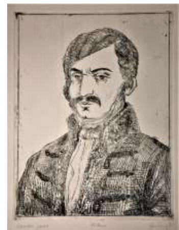
Monostori Viktória rézkarca Lavottáról

Első életrajzírója, Bernát Mihály szerint Lavotta 1786-ban fogott hozzá „számokra venni tüzes fantáziáinak különb-különbféle ízlésbeli talpkövekre állított írásbeli csomóit”, 2 1811-ben a 98. számnál, 1818 tavaszán pedig a 120. opusznál tartott. Lavottánál tehát legkevesebb 120 művével számolhatunk, melyek nagy részét – 65 opuszt – 1786 és 1797 között komponálta. Legjelentősebb forrása Lavotta műveinek az a kézirat-együttes, amely 1872-ben egy tömbben került a Nemzeti Zenede birtokába. Közöttük is Lavotta verbunkosainak ez idő szerint legteljesebb és terjedelmesebb forrása a Válogatott magyar nóták 18 darabból álló sorozata, amelyet – Domokos Mária feltételezése szerint – a szerző korábban írt verbunkosaiból reprezentatív válogatásnak szánhatta, s ezért nem látta el opusz számmal. Itt kell említést tennünk a 18. darabról, Lavotta legnépszerűbb verbunkos művéről, a „Homoródi” nótáról. Az igen szép Lassú magyar – különböző letétekben – összesen tizenegy múlt századi forrásban fordul elő, sőt – Pablo Sarasate Cigánydalok című műve révén, sajnálatosan szerzői megjelölés nélkül – még nemzetközi hírnévre is szert tett.