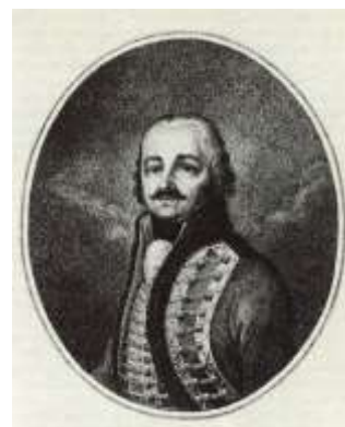
Báró Wesselényi Miklós