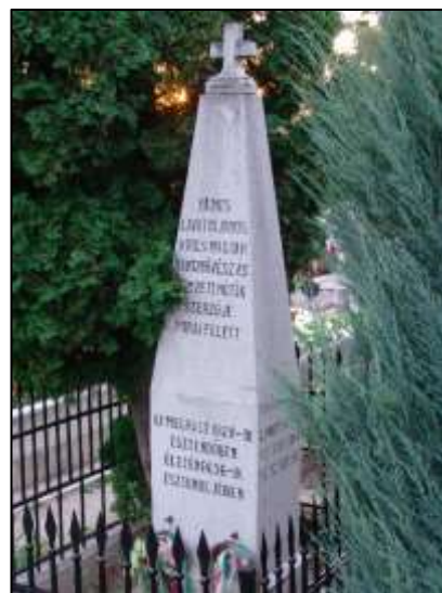
Lavotta János síremléke Tállyán