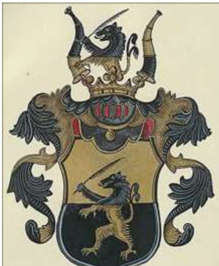
Lavotta család nemesi címere

családi nevet viselte, így a leszármazottak teljes megnevezése izsépfalvi és kevélyházi Lavottára változott. A Lavotta család genealógiai szempontból két ágra, az úgynevezett Zólyom vármegyei ágra és az Árva vármegyei ágra osztható fel. Tagjai évszázadok során számos nemességigazolással bizonyították származásukat. 1755-ben Lavotta (Lavotha) Mátyás az Árva vármegyében található Medzihradne helységben (szlovák falu Alsókubin mellett, ma: Medzihradné) nemesi telekadományban részesült, így a család ma is élő leszármazottai az Árva vármegyei ágat megalapító birtokadományos Lavotta Mátyástól származnak. A család legismertebb tagja, Lavotta (II.) János, a magyar zeneművészet kiválósága, 1764-ben született