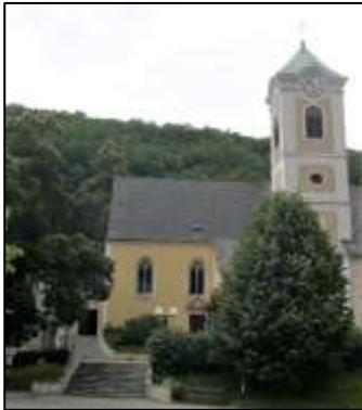
Szervita kolostor Fraknóvárallyán

címmel, amely egyelőre máig ismeretlen a kutatók számára. Olyannyira eredményes volt az első stúdium, hogy Lavottát „a közvélekedés ifjabb Zistlernek is nevezte.” 7