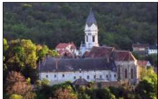
Sopronbánfalva pálos-karmelita kolostora

Vajon miben állt virtuozitásuk, s milyen követelményeket állíthatott hegedűvirtuózaink elé koruk-, a 18-19. századforduló hallgatósága? A bécsi klasszikus mesterek ekkorra már rég megkomponálták hegedűversenyeiket (Beethoven is befejezte 1806-ban). Ezek valamelyikének előadása támpontul szolgálhatna virtuozitásuk megítélésében. Nincs adatunk arról, hogy a triász tagjai közül valaki is játszott volna e hegedűversenyek közül, noha tudjuk, hogy Lavotta és Csermák gyakori szereplői voltak az un. muzsikai akadémiáknak. Azonban hegedűjátékukat