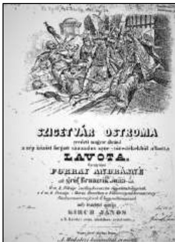
Szigetvár ostroma zongora átirata

A művek között a vonós kamarazene változatos, a kor divatos táncmuzsikájával találkozunk: verbunk, menüett, polonéz, kontratánc, ländler, tedesca, valamint figyelemre méltóak valószínűleg pedagógiai céllal írt darabjai, mint pl. a nehézségi sorrendbe állított 14 Könnyű hegedűduó , 6 Duetto Hungarica , 10 Ländler , vagy a 17 Kürtduó . Külön fejezetet alkotnak programzenéi: Szigetvár ostroma , Nota Insurrectionalis Hungarica (op.66), A vadászat (op.119), Az Égi Háború (op.120). Kiemelendő közülük az „eredeti magyar ábránd” műfaji megjelölésű, öt tételes – Tanácskozás, Ostromzaj, Végbúcsú, Ima, Harctérre rohanás – Szigetvár ostroma , amely eredetileg színpadi kísérőzenének készült. Kézirata eddig nem került elő, a művet Kirch János 1843-ban kiadott zongora-átiratából ismerjük. 3