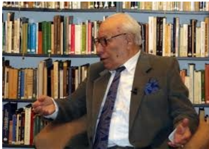
A Csuka Zoltán könyvtárban

- Sose kíméltem magam, próbáltam úgy élni, mint egy civil ember. Részt kellett vállalnom a házi teendőkből, család apa-anya voltam egy személyben, feleségem sokat betegeskedett. Mostam, vasaltam, reggel ébresztettem a fiamat, reggelit készítettem, indultam bevásárolni. Nehéz színházi feladatomra így töltöttem fel. Persze előadás előtt nem fárasztottam ki magam.