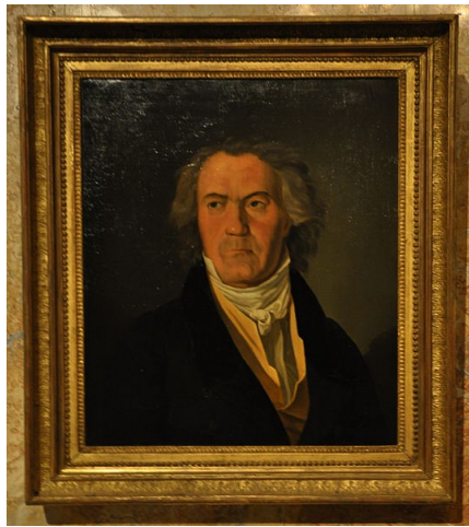
Ferdinand Georg Waldmüller: Ludwig van Beethoven (1823)

1821-ből származik az első olyan észrevétel, hogy Beethoven átmenetileg sárgaságban megbetegedett. 1823-ban Waldmüller festőművész portrét készített Beethovenről. A képen határozottan látható, hogy a bőrszín enyhén sárgás volt. Krónikus májbetegsége 1825-ben már súlyos tüneteket okozott. Nyelőcsővisszérből származó vérzése támadt. 1826-ban a májcirrhosis (májzsugor) miatt ascites (hasvízkór) alakult ki. Többször kellett haspunkcióval folyadékot lebocsátani. Előfordul, hogy 11-12 liter folyadékot engedtek le a hasából.