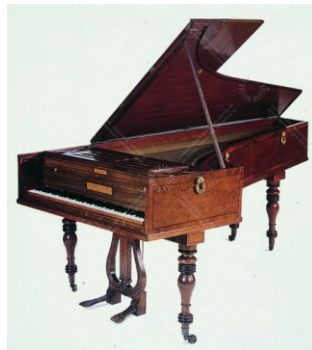
Thomas Broadwood, London, 1817 1

Ha a rendellenes csontosodás itt következik be, akkor cochlearis otosclerosisról beszélünk. A vezetékes hallásromlás mellett nem törvényszerű, hogy idegi halláscsökkenés és szédülés jelentkezzen. Egyetlen tünet van, amely nem erősíti meg ezt az utólagos diagnózist: mégpedig az, hogy a légvezetés kevésbé volt rossz, mint a csontvezetés. A cochlearis otosclerosis esetén egyaránt romlik a csontvezetés és a légvezetés. De honnan tudjuk, hogy Beethoven esetében a csontvezetés jobb volt? Onnan, hogy fa dobverőt használt hallásának javítására. Csakhogy nem teljesen bizonyos, hogy ezen a módon a csontvezetést használta ki. A csontvezetésnél ugyanis az történik, hogy a csontok rezgéseit ugyanúgy átveszi a belső fül, mint rendes hallás esetén a levegő rezgéseit, és a belső fülben ugyanolyan idegingerületek jönnek létre, mint rendes hallásnál. A csontvezetés esetében tehát végül is az agy hangrezgéseket érzékel. Nos, nem valószínű, hogy Beethoven ilyen módon érzékelt volna hangrezgéseket a belső fülben, a cochleánál létrejött elcsontosodás miatt. Sokkal valószínűbb, hogy az arc és a koponyacsontok rezgése valami más módon alakult át benne hangélménnyé. Ismeretes, hogy a rosszul halló emberek némelyike a vibrációt úgy tudja felfogni, mint hangélményt. Beethoven is minden bizonnyal a zongora hangrezgéseit, a vibrációt érzékelt a zongorához nyomott fapálca útján, és ez az érzet alakult át benne hangélménnyé. Beethoven hallásának rendkívül súlyos romlása így magyarázható legelfogadhatóbban.