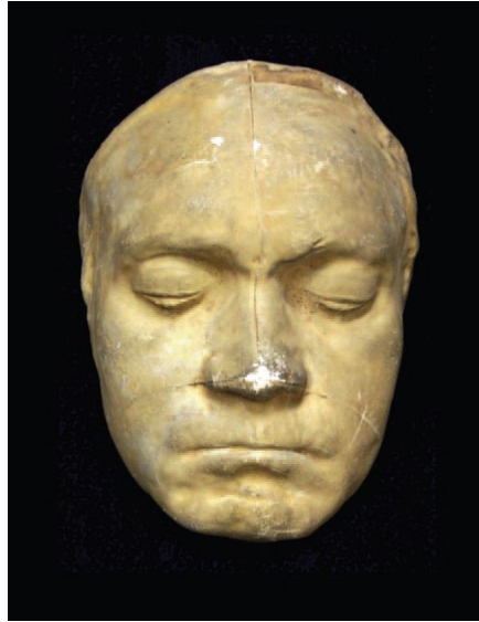
Beethoven halotti maszkja

Beethoven halála után hangszerét elárverezték. Több évi hányódás után a zongora méltó kezekbe került: Liszt Ferenc vásárolta meg. „Kötelességem e felbecsülhetetlen relikviát hazám műbarátainak felajánlani...” – írta 1873-ban Liszt, és a Broadwood-zongorát odaajándékozta a Magyar Nemzeti Múzeumnak. Billentyűin szólaltak meg először az életművet lezáró óriás művek, a Hammerklavier szonáta, és az op. 110 és 111-es zongoraszonáták.