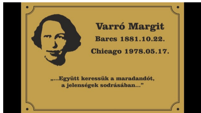
1. ábra – Emléktábla – Barcs, Vikár Béla Zeneiskola AMI